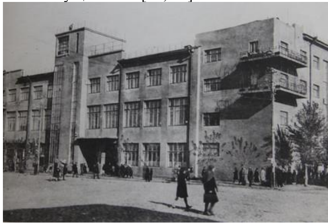
Рисунок 10. Воронеж. Здание железнодорожной поликлиники на проспекте Революции, 2. Фото 1930-е гг.

В 1928 г. Д. А. Дегтярёв уезжает в г. Воронеж, где в 1928–1946 гг. работал в различных проектных организациях. В 1930-е гг. он был преподавателем архитектуры в Воронежском инженерно-строительном институте. Перед Великой Отечественной войной Д. А. Дегтярёв занимал должность главного архитектора г. Воронежа. Здесь он стал автором ярких конструктивистских проектов жилых и общественных зданий: жилой дом на ул. Комиссаржевской, железнодорожная поликлиника на проспекте Революции, 2 (1929) (рисунок 10), жилой дом на ул. Володарского, 70 (начало 1930-х), Госбанк на ул. Театральной, 36 (1931–1932;), которое было восстановлено по его же проекту после Великой Отечественной войны. В 1944 г. Дегтярев выполнил проект на строительство здания обкома ВКП(б), который не был осуществлен [18; 19].