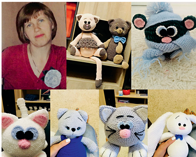
Зверюшки, сделанные А.Ф. Филимоновой, начальником муниципального архива Поньковского района