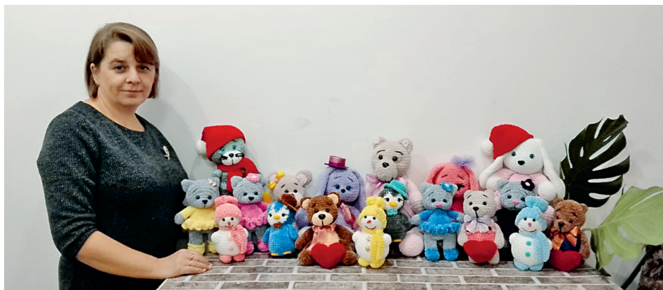
Подделки, связанные В.Н. Шаталовой, ведущим специалистом-экспертом муниципального архива Суджанского района