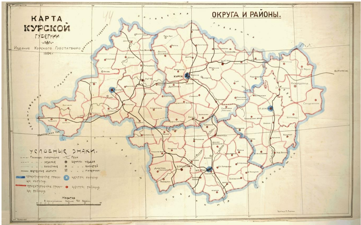
Карта Курской губернии с предполагаемым делением ее территории на районы и округа. 1924 г. (ГАКО. Ф. Р-202. Оп. 1. Д. 1010. Л. 44)