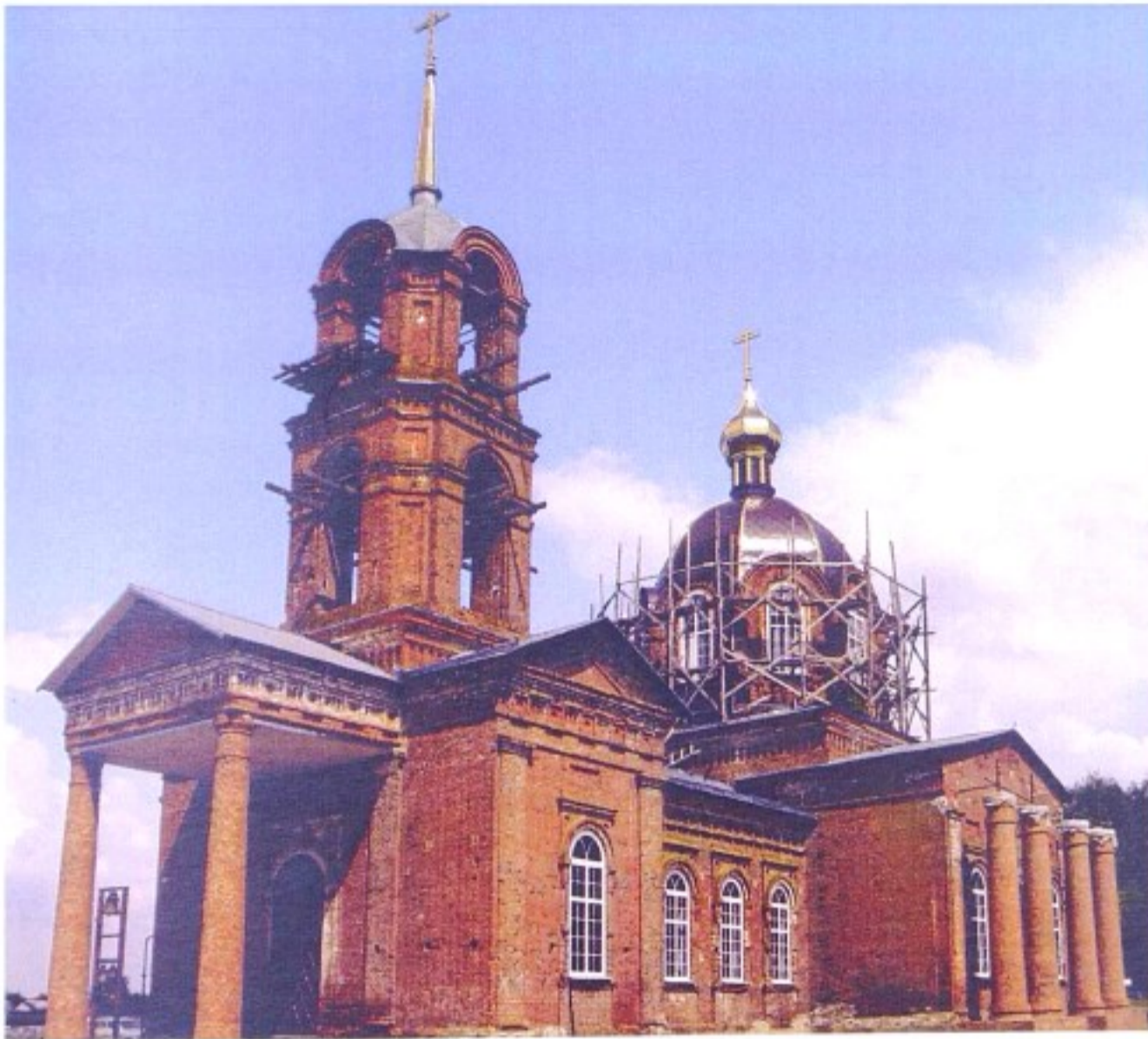
Храм вмч. Димитрия Солунского с. Болото. 2000 г.

До 1928 г. с. Болото входило в состав Горшеченской волости Нижнедевицкого (до 1923 г. – Землянского) уезда Воронежской губернии, в 1928 – 1934 гг. – в Горшеченский р-н, с 1935 г. – в состав Ясеновского района, с 1956 г. – в состав Горшеченского района.