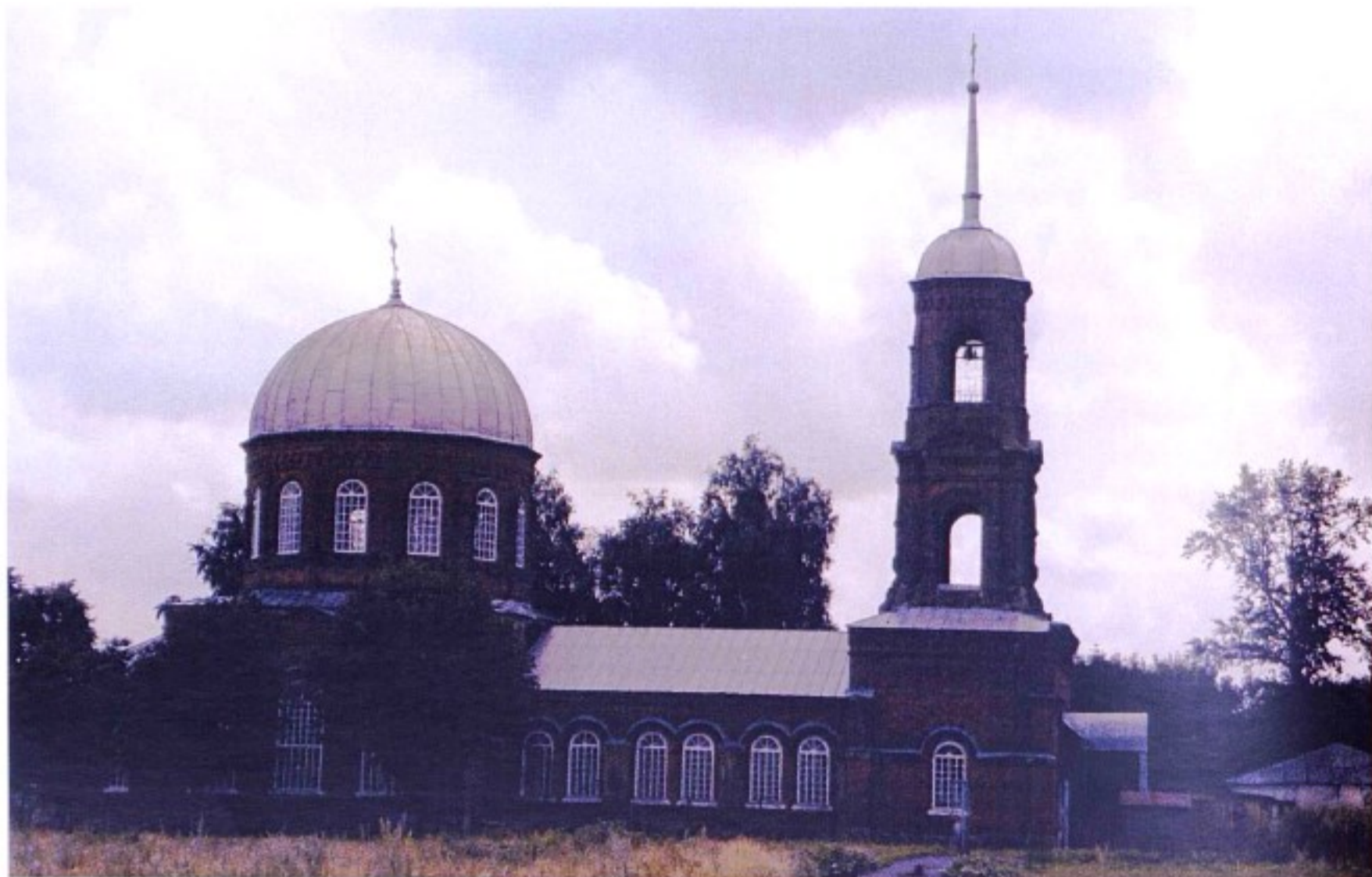
Тихвинский храм с. Кулевка. 2000 г.

До 1928 г. село входило в состав Горшеченской волости Нижнедевицкого (до 1923 г. – Землянского) уезда Воронежской губернии, в 1928 – 1934 гг. – в Горшеченский р-н ЦЧО, с 1935 г. – в состав образованного Ясеновского р-на, с 1956 г. – в состав Горшеченского р-на.