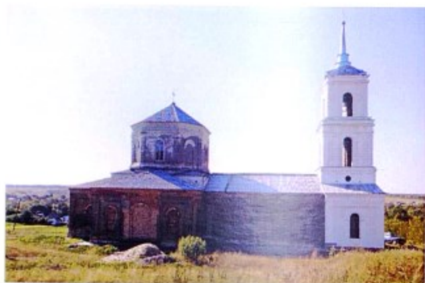
Храм Архангела Михаила с. Погожево