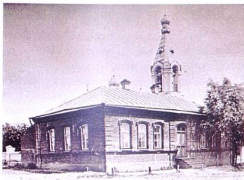
Церковно-приходская школа при Введенском храме п. Тим [не ранее 1900 г.]