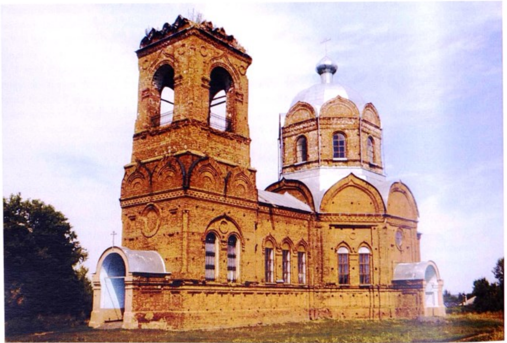
Храм вмч. Георгия Победоносца с. Гнилое

До 1963 г. село Гнилое (Гнилой Колодезь) входило в состав Тимского района (до 1928 г. – уезда), в 1963 г. в состав Щигровского района, с 1964 г. – в состав Тимского района.