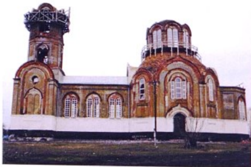
Церковь Ахтырской иконы Божией Матери с. Верхняя Грайворонка

До 1928 г. село Верхняя Грайворонка входило в состав Горшеченской волости Землянского (с 1923 г. – Нижнедевицкого) уезда Воронежской губернии, в 1928–1934 гг. – в состав Касторенского р-на, с 1935 г. – в состав Октябрьского р-на, с 1956 г. – в состав Касторенского р-на.