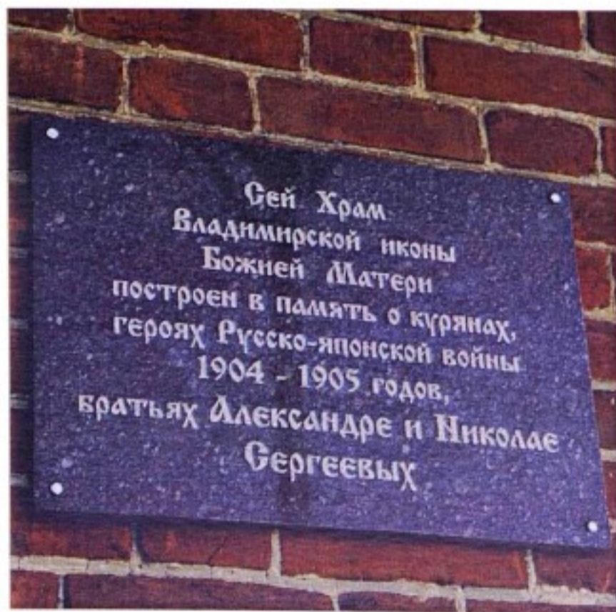
Памятная доска на Владимирском храме с. Стаканово

Согласно клировой ведомости 1889 г., престолов было три: главный – во имя Владимирской Божией Матери, с правой стороны – во имя святой мученицы Параскевы, с левой стороны – во имя преподобного Сергея Радонежского. После перестройки храма третий престол именовался в честь Симеона Богоприимца. 5