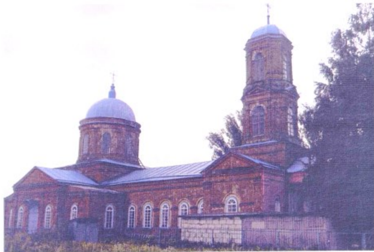
Храм Архангела Михаила с. Старороговое

До 1928 г. с. Старороговое (Старо Роговое, Роговое) входило в состав Горшеченской волости Нижнедевицкого (до 1923 г. – Землянского) уезда Воронежской губернии, в 1928 – 1934 гг. – в Горшеченский р-н, с 1935 г. – в состав Ясеновского р-на, с 1956 г. – в состав Горшеченского р-на.