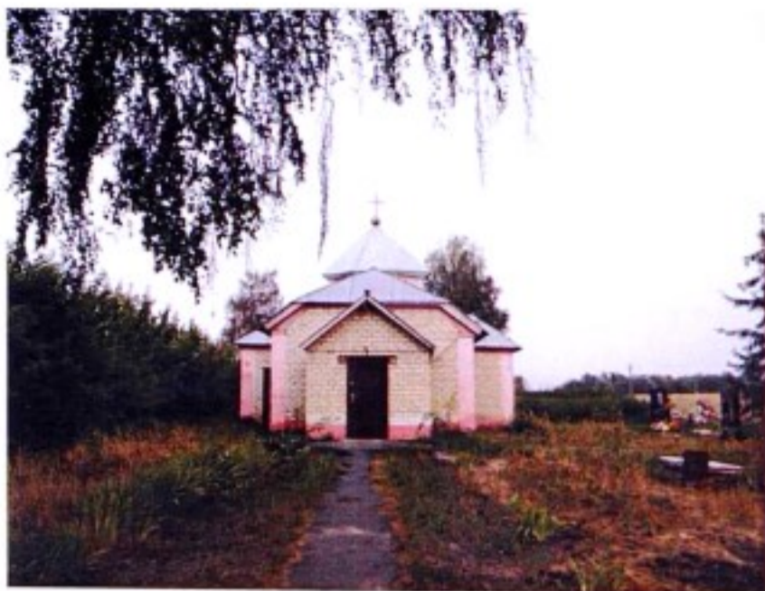
Свято-Троицкий Храм в с.Бунино

молитвенный дом в с. Бунино, деревянный площадью 50 кв.м. 10