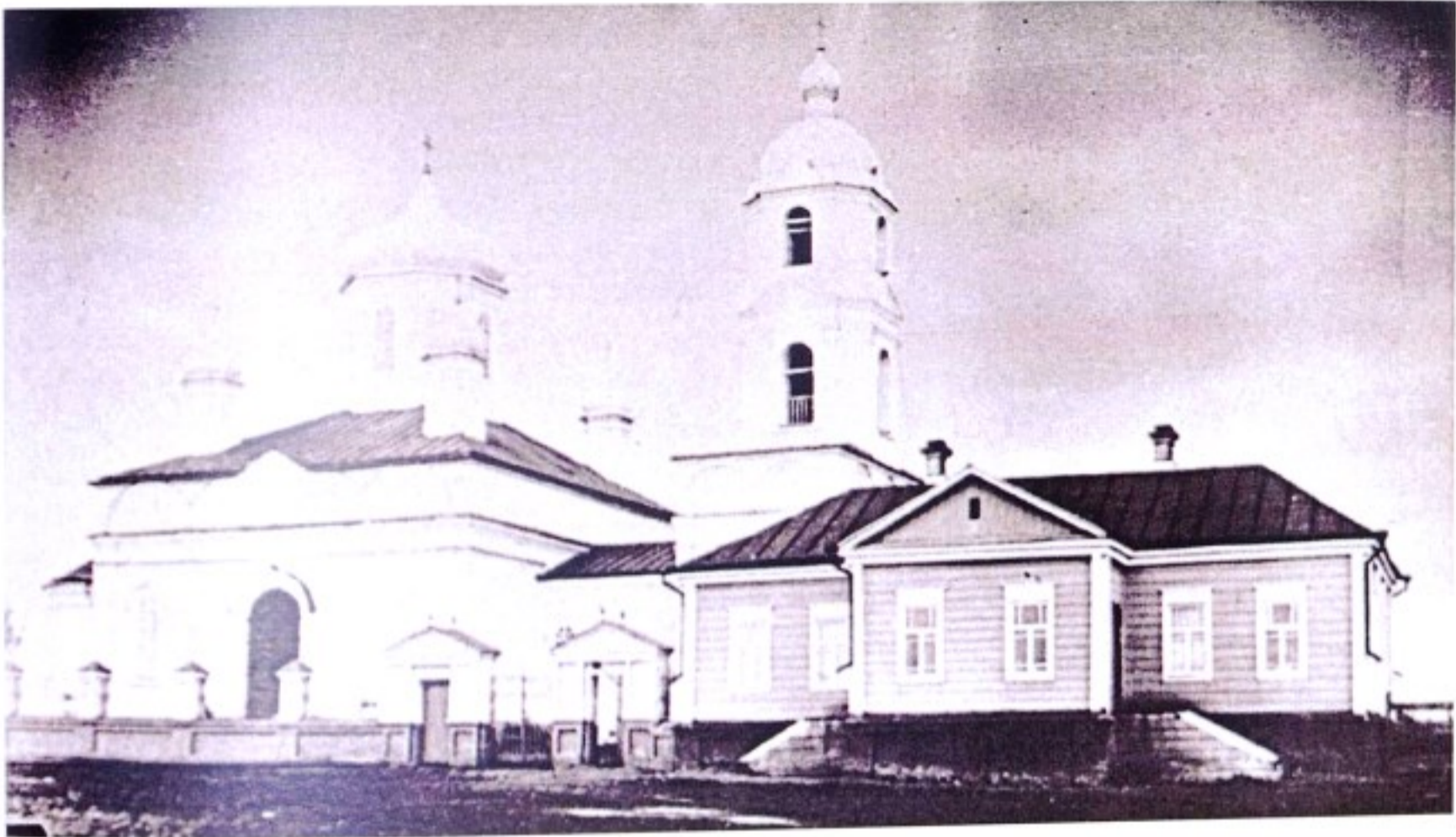
Церковно-приходская школа Георгиевской церкви с. Становое. [1980-е гг.]

До 1963 г. село Становое (Становой Колодезь) входило в состав Тимского р-на (до 1928 г. – уезда), в 1963 г. в состав Щигровского р-на, с 1964 г. – в состав Тимского р-на.