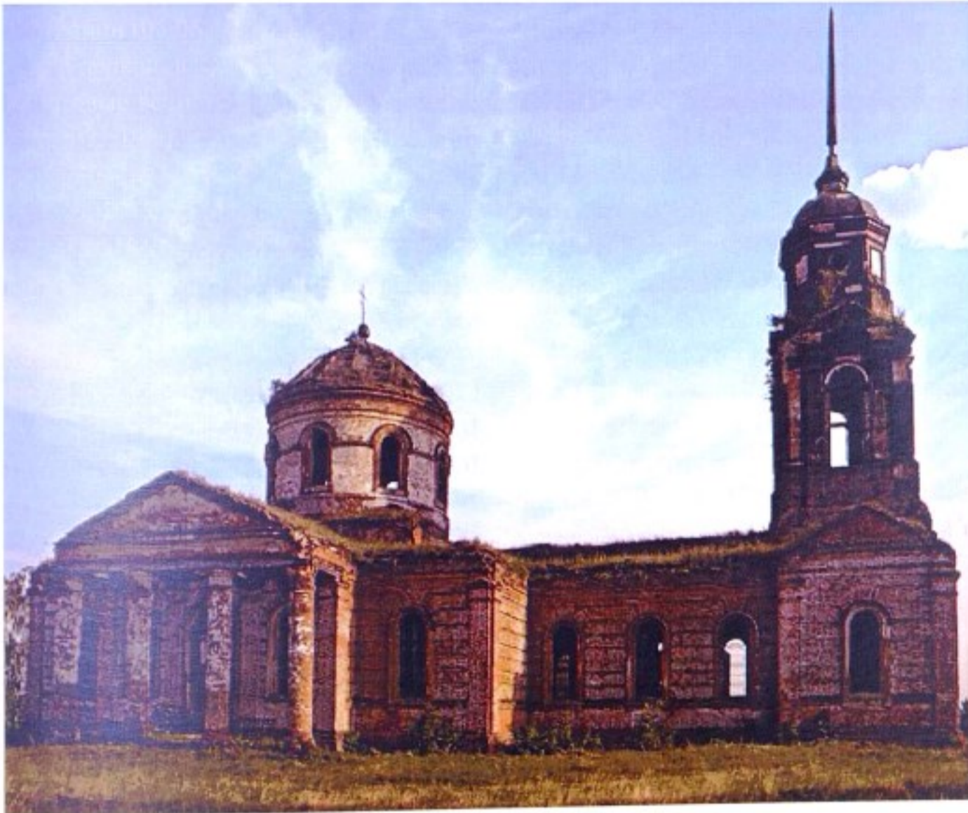
Никольский храм с. Гололобовка.

В справочниках административно-территориального деления до 1917 г. и справочных изданиях Курской епархии населенный пункт с названием Гололобовка не числится.