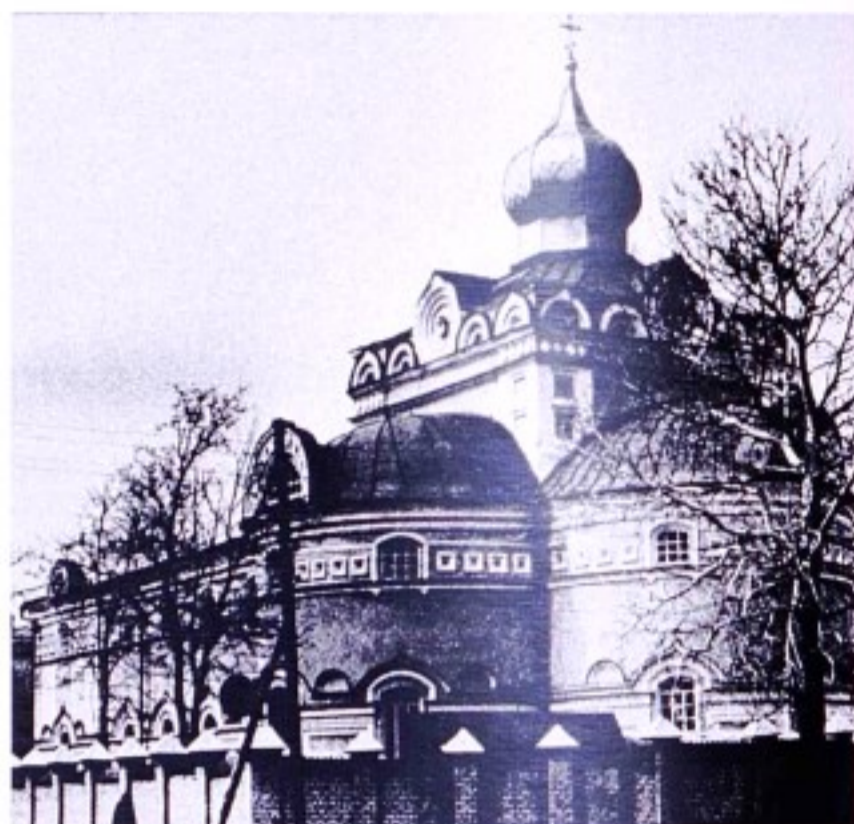
Троицкий храм г. Щигры. [1990 г.]

Алтарь и трапезная с хорами в длину по 7 арш. В церкви 16 окон, в алтаре – 7, в трапезе – 6. Дверей: