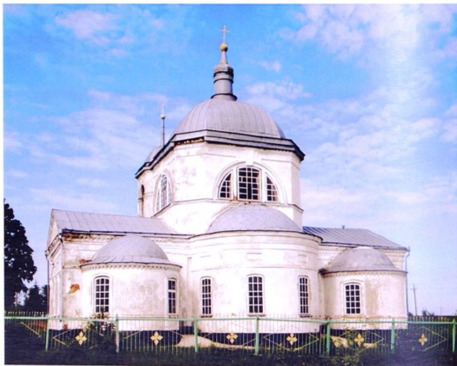
Храм вмч. Димитрия Солунского с. Успенка

До образования в 1928 г. Касторенского района село входило в состав Касторенской волости Нижнедевицкого (до 1923 г. – Землянского) уезда Воронежской губернии, с 1928 г. – в Касторенский р-н ЦЧО, с 1934 г. – в Касторенский р-н Курской области.