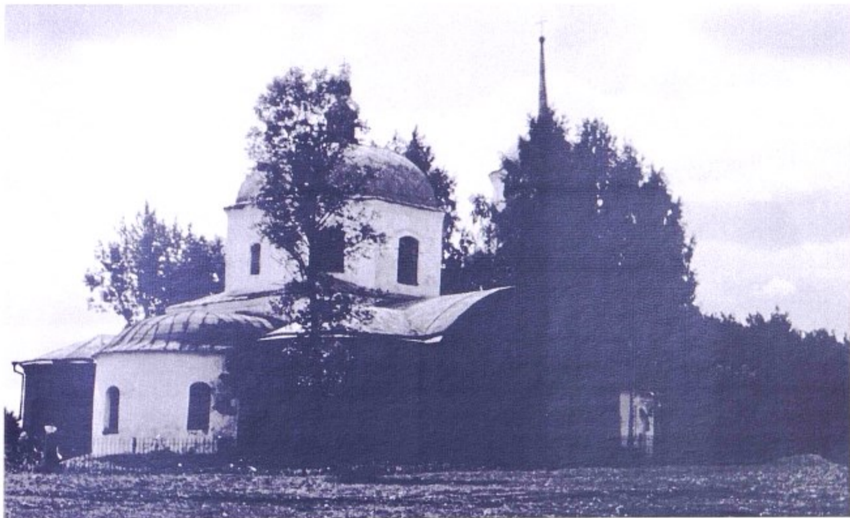
Дмитриевский храм с. Репец. 1995 г.

До 1924 г. село входило в состав Тимского уезда, с 1924 г. – в Щигровский уезд, с 1928 г. – в Ястребовский р-н, с 1930 г. – в Старооскольский р-н, с 1935 г. – в Ястребовский р-н, с 1963 г. – в Горшеченский р-н, с 1977 г. – в состав Мантуровского р-на.