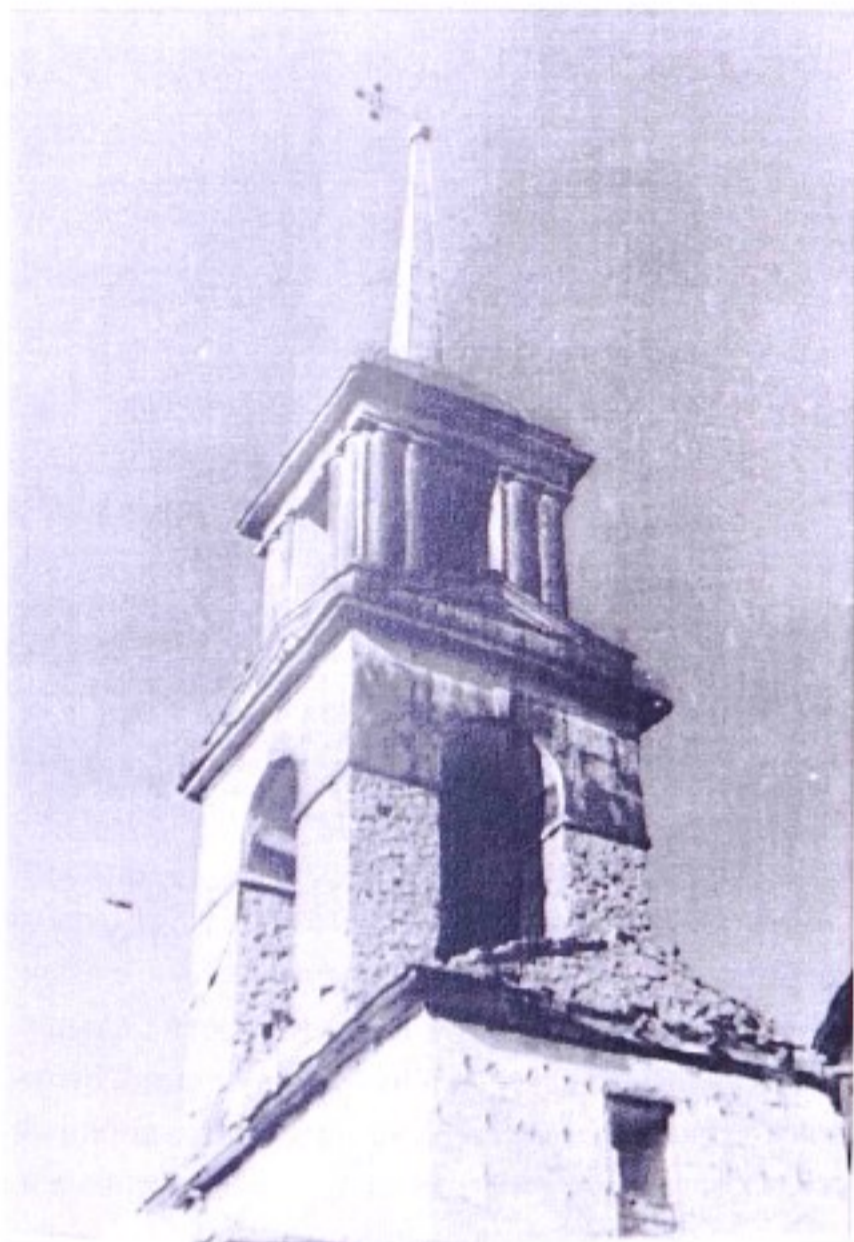
Успенская церковь с. Успенка. 1962 г.

До 1924 г. с. Успенка (Успенское, что на Белом Колодезе, Белый Колодезь, Колодезь Белый) входило в состав Тимского уезда, с 1924 г. – в Щигровский уезд, с 1928 г. – в Тимский р-н, в 1963 г. – в состав Щигровского р-на, с 1964 г. – в состав Тимского р-на.