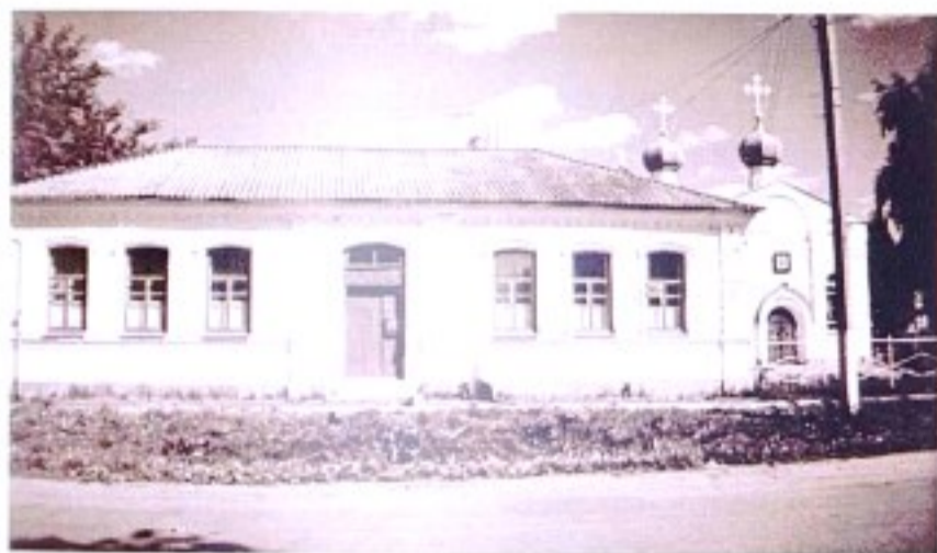
Введенский храм п. Тим