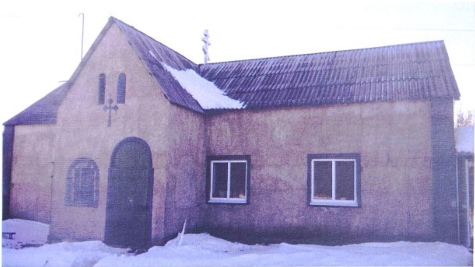
Знаменский храм с. Пузачи

До 1924 г. село Пузачи входило в состав Тимского уезда, с 1924 г. – в Щигровский уезд, с 1928 г. – в Тимский р-н, с 1935 г. – Мантуровский р-н, с 1963 г. – Солнцевский р-н, с 1964 г. – в Тимский р-н, с 1977 г. – Мантуровский р-н.