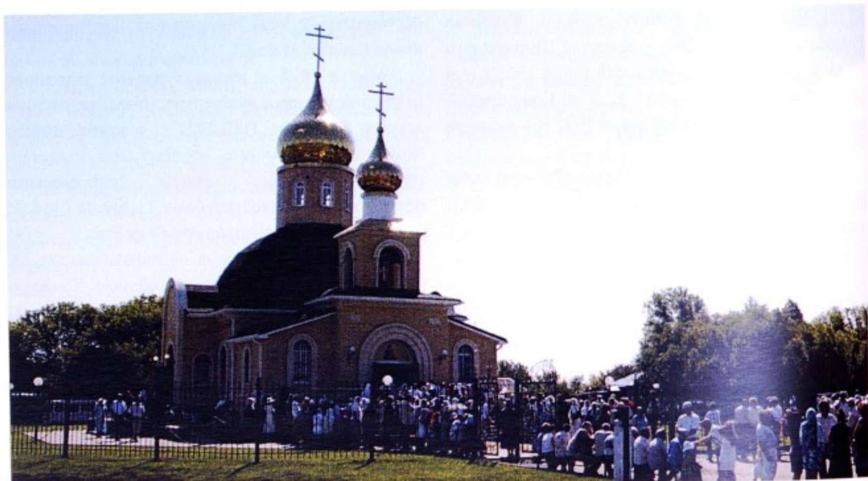
Тихвинский храм с. Ястребовка.

До образования в 1928 г. Ястребовского р-на его территория входила в состав Старооскольского уезда; в 1928 – 1930 гг. – в Ястребовский р-н, с 1930 г. – в состав Старооскольского р-на, с 1935 г. – в состав восстановленного Ястребовского р-на, с 1963 г. – в состав Горшеченского, с 1977 г. – Ястребовский сельсовет вошел во вновь образованный Мантуровский р-н.