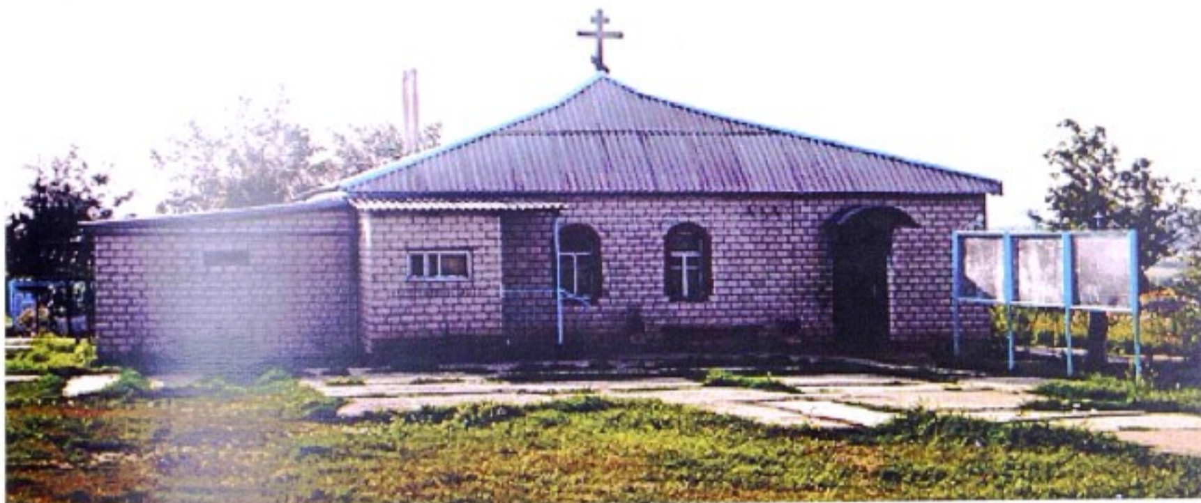
Покровская церковь с. Покровское. Август 2013 г.

До образования Черемисиновского района в 1928 г. с. Покровское (Покровское на Тиму) входило в состав Курского, затем с 1930 г. – в состав Щигровского уезда, с 1935 г. – в состав Черемисиновского, с 1963 г. – в состав Щигровского, с 1966 г. – в состав Черемисиновского района.