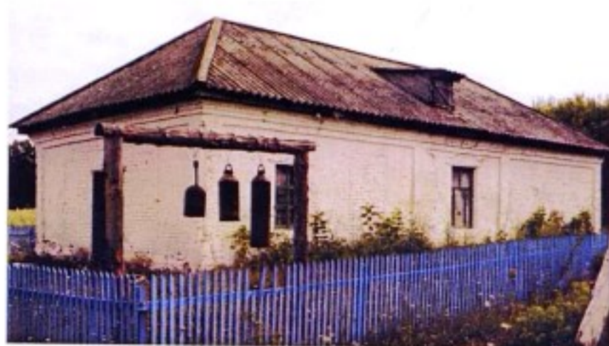
Знаменский храм с. Знаменка

предназначенные для богослужения, с указанием их количества, размера, физического состояния. 4