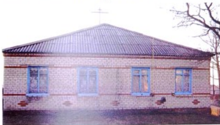
Фасад здания Православного Прихода храма Воздвиженья Креста Господня в д. Пожидаевка Знаменского сельсовета

Первое упоминание о Знаменской церкви с. Знаменка встречается в ревизской сказке церковно-и священнослужителей по 2-й ревизии Курского уезда за 1744г., где говорится о церкви Знамения Пресвятой Богородицы с. Знаменского. 1 Само село лежало «на речке Теребуже, которая вышла из Теребужских верхов протяжением 16 верст» в нем церковь деревянная во имя Знамения Пресвятой Богородицы. 2