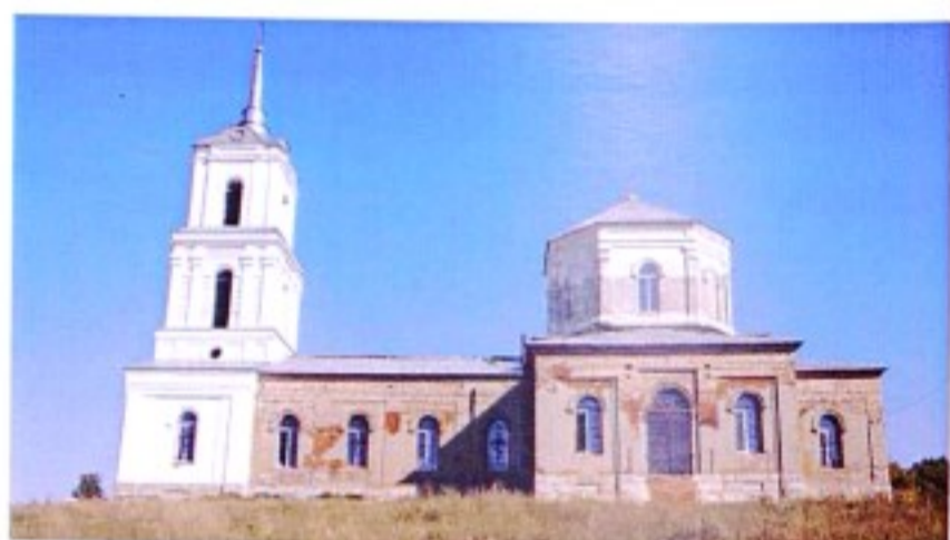
Храм Архангела Михаила с. Погожево

До образования в 1928 г. Касторенского района село Погожево (Погожее) входило в состав Касторенской волости Землянского (с 1923 г. – Нижнедевицкого) уезда Воронежской губернии, с 1928 г. – в Касторенский р-н ЦЧО, с 1934 г. – в Касторенский р-н Курской области.