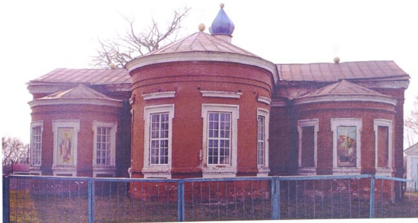
Успенская церковь с. Бобрышево

Село Бобрышево входило в состав Обоянского уезда вплоть до 1924 г., постановлением ВЦИК от 12 мая 1924 г. Обоянский уезд был упразднен, Бобрышево вошло в состав Курского уезда, а с 1928 г. – в созданный Обоянский район. В 1935 г. село вошло в Кривцовский район, с его упразднением в 1957 г. относится к территории вновь созданного Пристенского района.