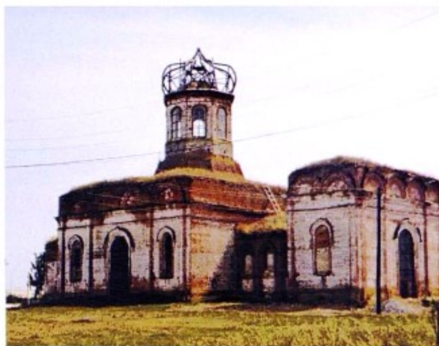
Храм вмч. Георгия Победоносца с.Становое.