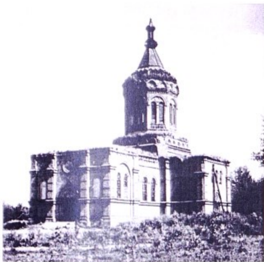
Храм Казанской Божией Матери с. 2-е Мелехино

Если крестьяне деревни Мелехиной желают иметь при своем храме причт, чтобы они обеспечили его содержанием и землей. При нашем старом храме причтовая земля отведена нашими предками по приговору 2-го октября 1790 г.» 7