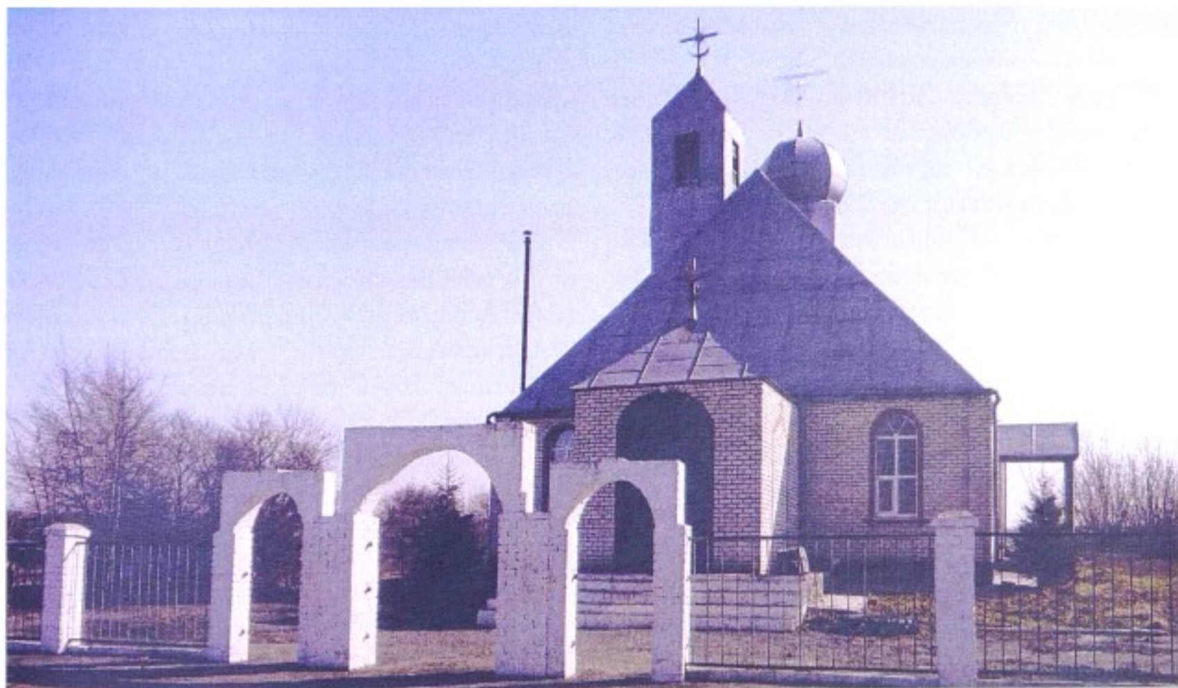
Храм Архангела Михаила с. Репецкая Плата

До 1924 г. село Репецкая Плата входило в состав Тимского уезда, с 1924 г. – в состав Щигровского уезда, с 1928 г. – в Солнцевский р-н, с 1935 г. – в Мантуровский р-н, с 1963 г. – в Солнцевский р-н, с 1964 г. – в Тимский р-н, с 1977 г. – в состав Мантуровского р-на.