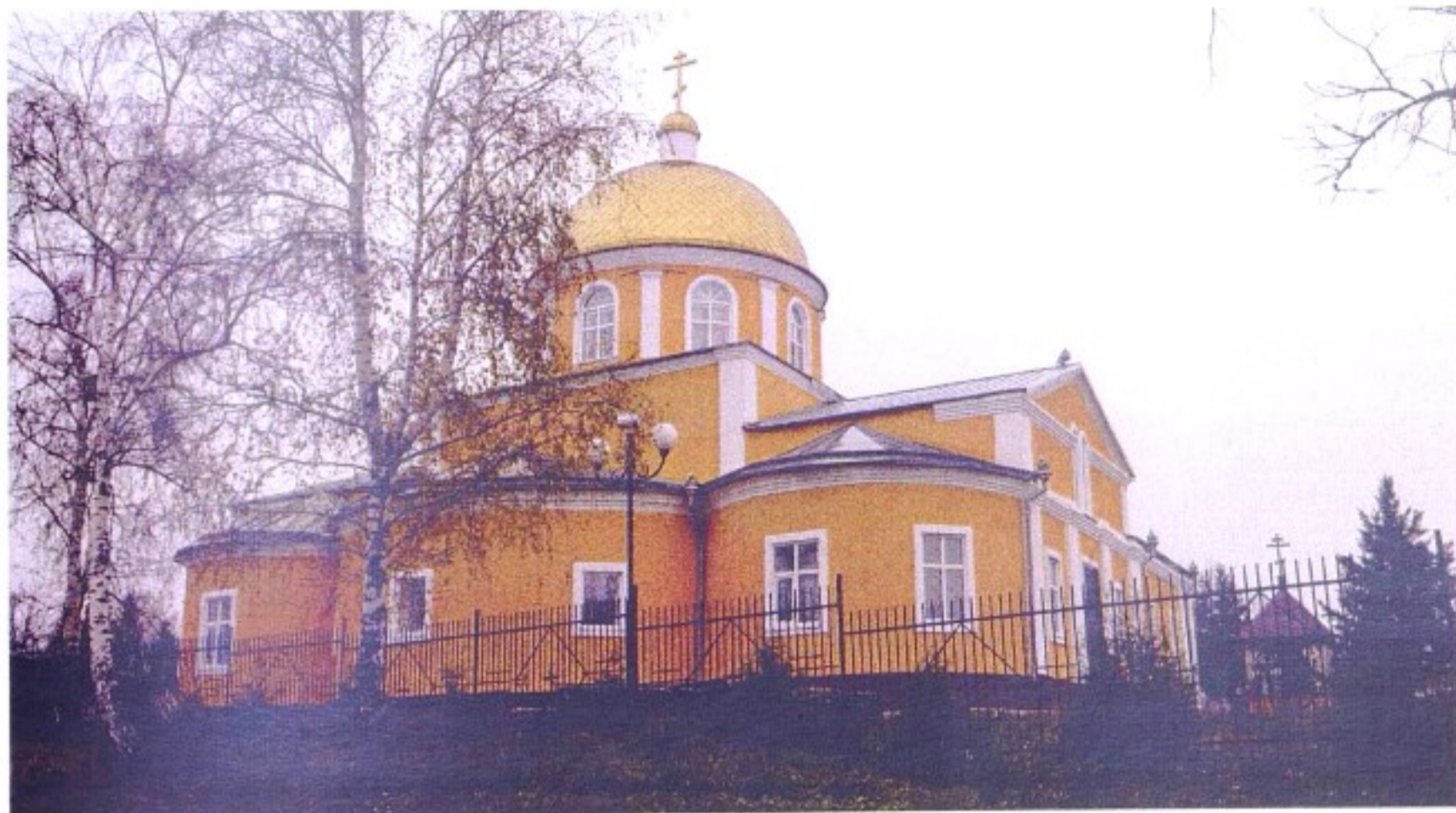
Никольский храм с. Мантурово.

До 1924 г. село Мантурово (слобода Мантуровка, Мантурово) входило в состав Тимского уезда, с 1924 г. – в состав Щигровского уезда, с 1928 г. – в Солнцевский р-н, с 1935 г. – в Мантуровский р-н, с 1963 г. – в Солнцевский р-н, с 1964 г. – в Тимский р-н, с 1977 г. – в состав Мантуровского р-на.