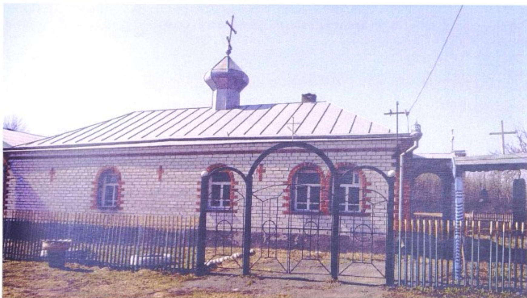
Храм иконы Божией Матери Всех скорбящих Радость с.Останино

До 1924 г. село Останино входило в состав Тимского уезда, с 1924 г. – в Щигровский уезд, с 1928 г. – в Солнцевский р-н, с 1935 г. – Мантуровский р-н, с 1963 г. – Солнцевский р-н, с 1964 г. – в Тимский р-н, с 1977 г. – Мантуровский р-н.