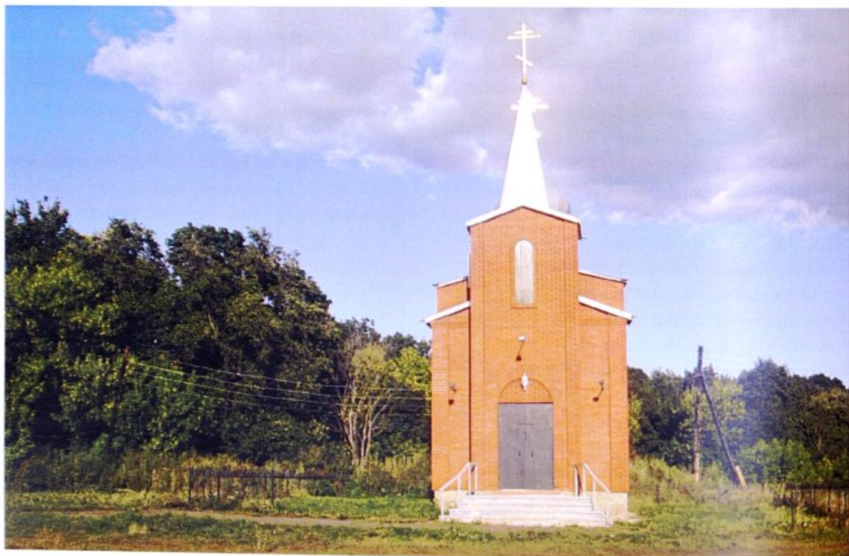
Храм свт. Николая с. Грязное

До 1802 г. с. Грязное входило в состав Старооскольского уезда Курской губернии, с 1802 по 1928 г. – в состав Тимского уезда, с 1928 г. – в состав Советского района.