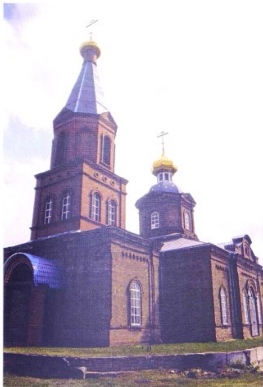
Тихвинская церковь с. Бараново

До образования в 1928 г. Ястребовского р-на село входило в состав Старооскольского уезда Курской губернии, с 1928 по 1930 гг. – в состав Ястребовского р-на, с 1930 по 1935 гг. – в состав Старооскольского р-на, с 1935 г. – в состав Ястребовского р-на, с 1964 г. – Горшеченского района.