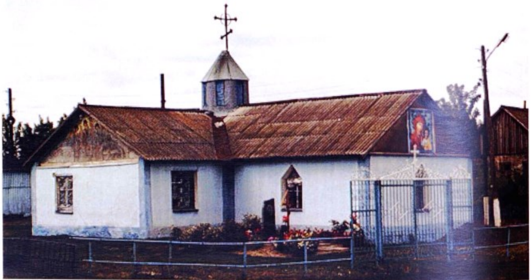
Приход Казанской иконы Божией Матери с. Субботино

До образования в 1928 г. Солнцевского района с. Субботино входило в состав Тимского уезда.