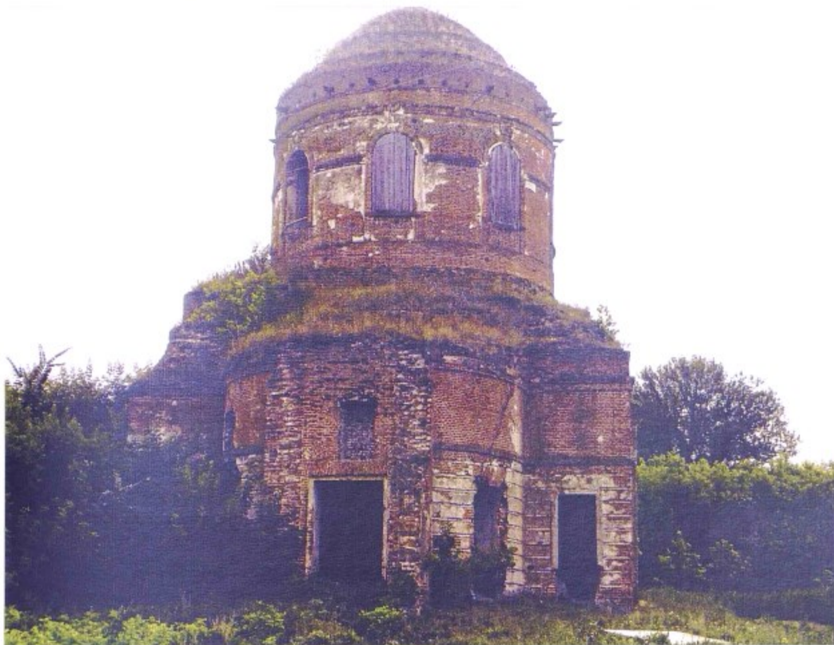
Знаменский храм с. Знаменка

До образования в 1928 г. Ястребовского района с. Знаменка (с. Знаменское) входило в состав Старооскольского уезда Курской губернии, с 1928 по 1930 гг. – в состав Ястребовского, с 1930 по 1935 гг. – в состав Старооскольского р-на, с 1935 г. – в состав Ястребовского р-на, с 1964 г. – в состав Горшеченского района.