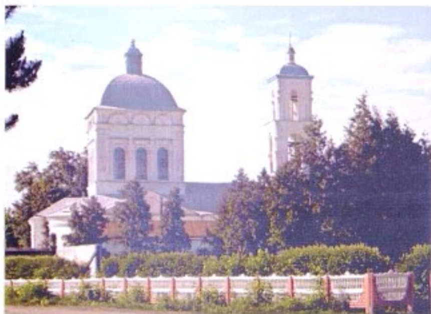
Успенский храм с. Касторное

приеме здания храма в бессрочное и безвозмездное пользование. 5 В описи, составленной при заключении договора, указано 44 наименования предметов, в том числе 11 больших икон в ризах, 16 деревянных икон без риз, 2 маленьких медных колокольчика. 6