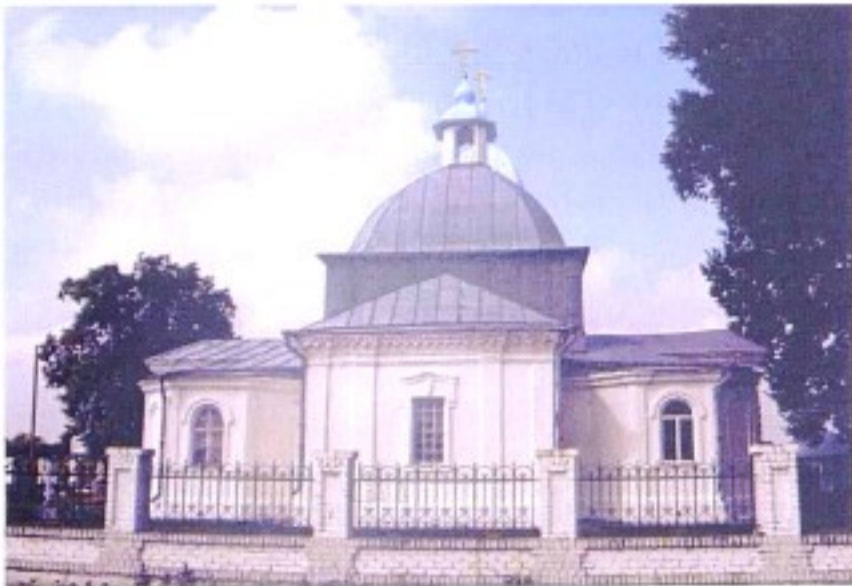
Покровский храм с. Кунье.

В церковной библиотеке был 21 том богослужебных книг и 92 тома книг для чтения, в т.ч. издания церковных и епархиальных ведомостей. Всего в описи было перечислено 83 предмета с указанием их веса. 5