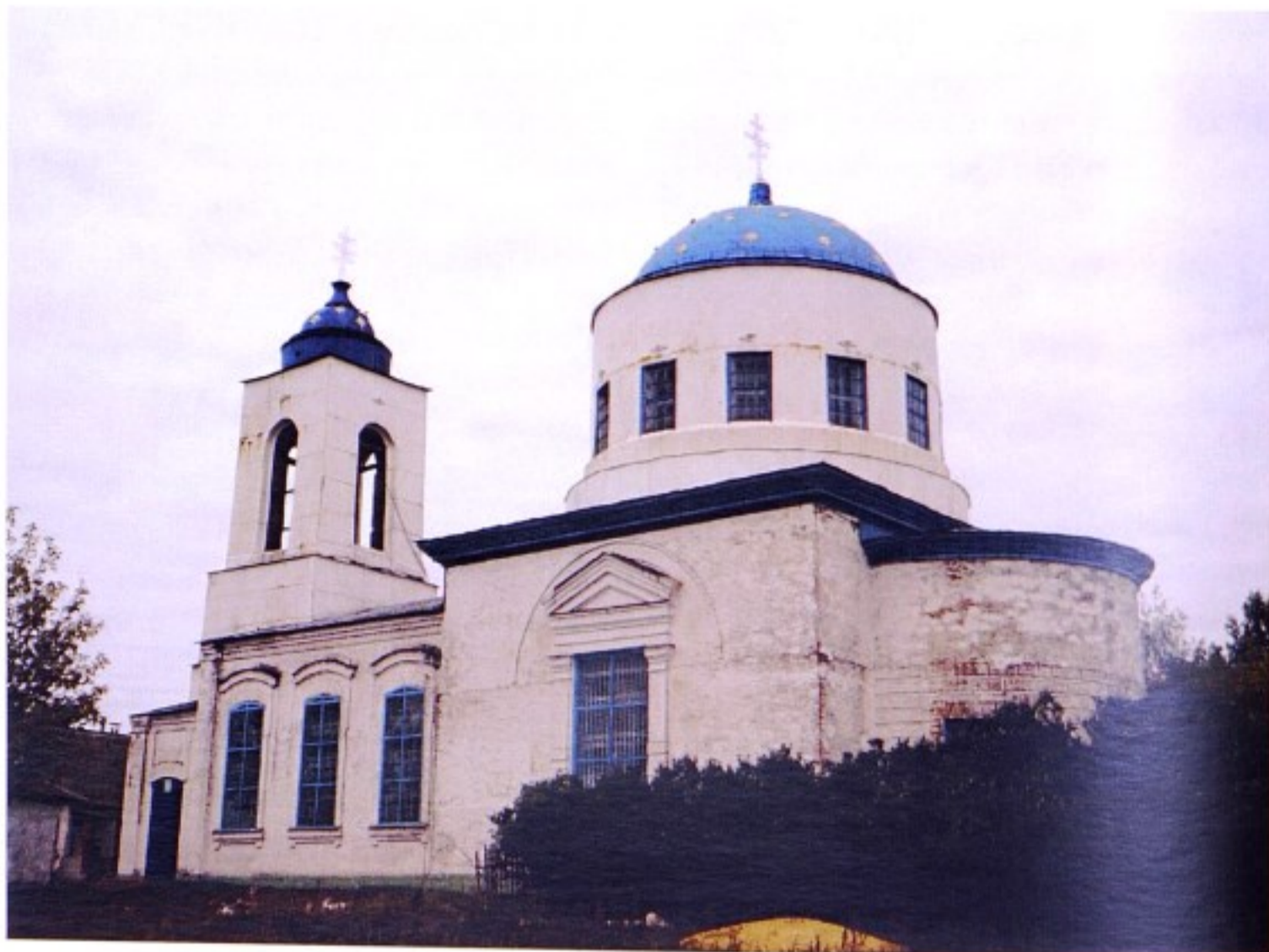
Храм Владимирской иконы Божией Матери с. Красная Долина. 2009 г.