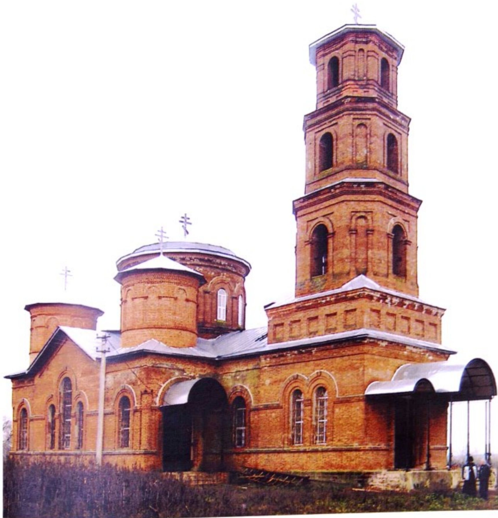
Храм Владимирской Божьей Матери

До образования Черемисиновского района в 1928 г., с. Стаканово значилось в Щигровском уезде Курской губернии, с 1928 г. – в составе Щигровского района, с 1935 г. – в составе Черемисиновского, с 1963 г. – в составе Щигровского, с 1966 г. – в составе Черемисиновского района.