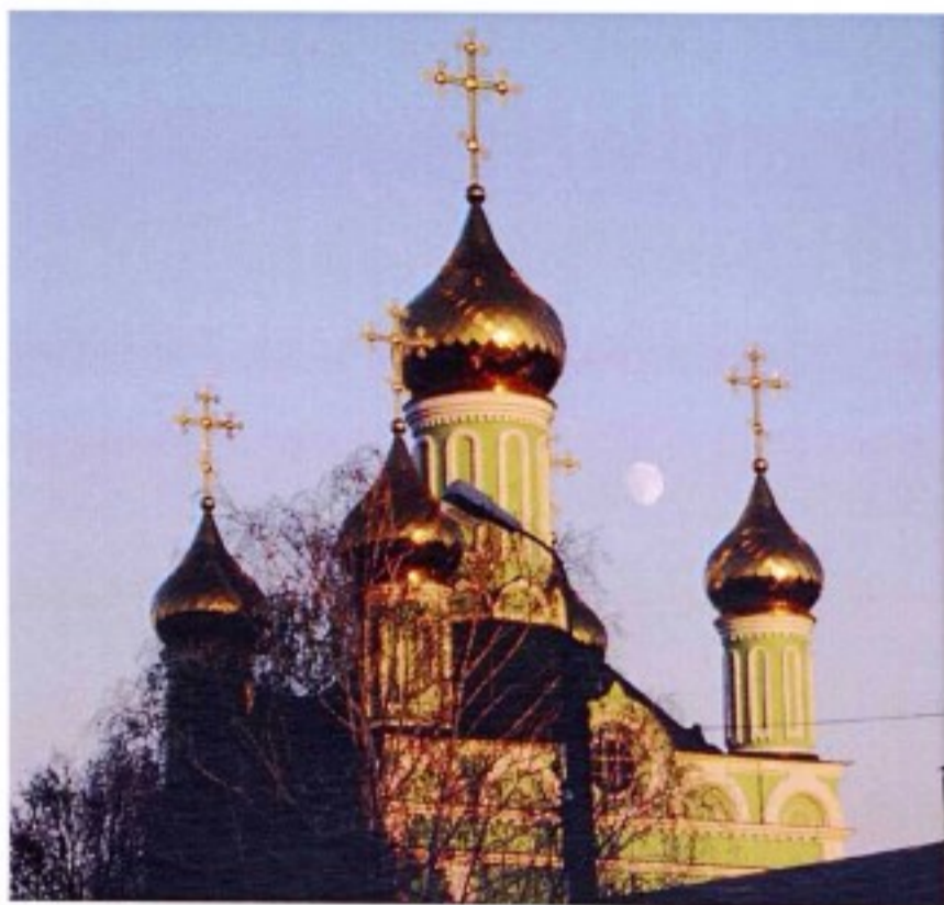
Троицкий храм г. Щигры

«Город сей до получения своего достоинства был селом экономического ведомства в уезде Курском, и назывался селом Троицким, Щигры тож. Стрoения в городе все деревянные, церковь Живоначальной Троицы...». 1 Так говорится о городе Щигры в «Топографическом описании Курской губернии» (1784 г.).