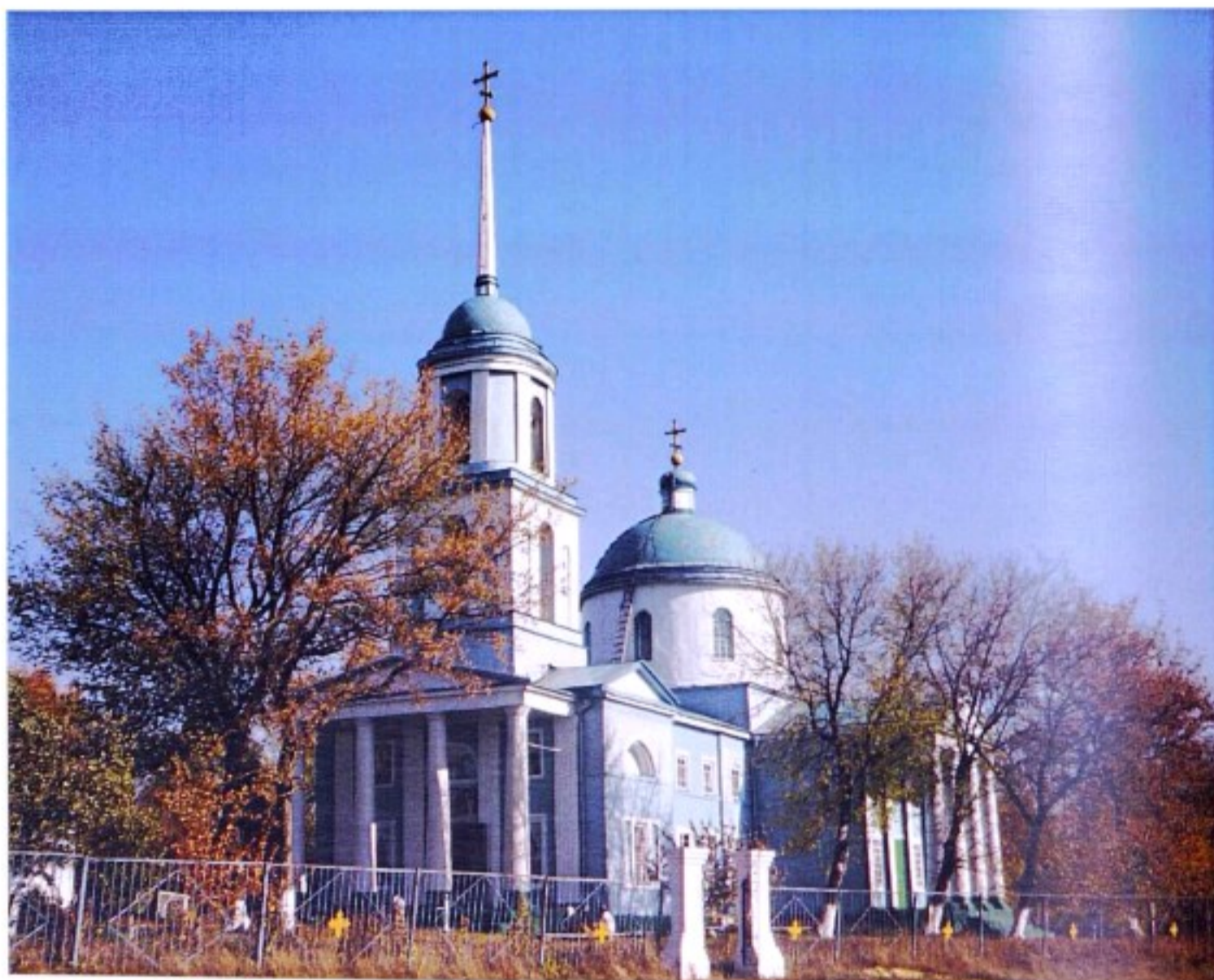
Храм Владимирской иконы Божией Матери с. Липовчик.

До образования в 1928 г. Советского района село Липовчик входило в состав Щигровского уезда.