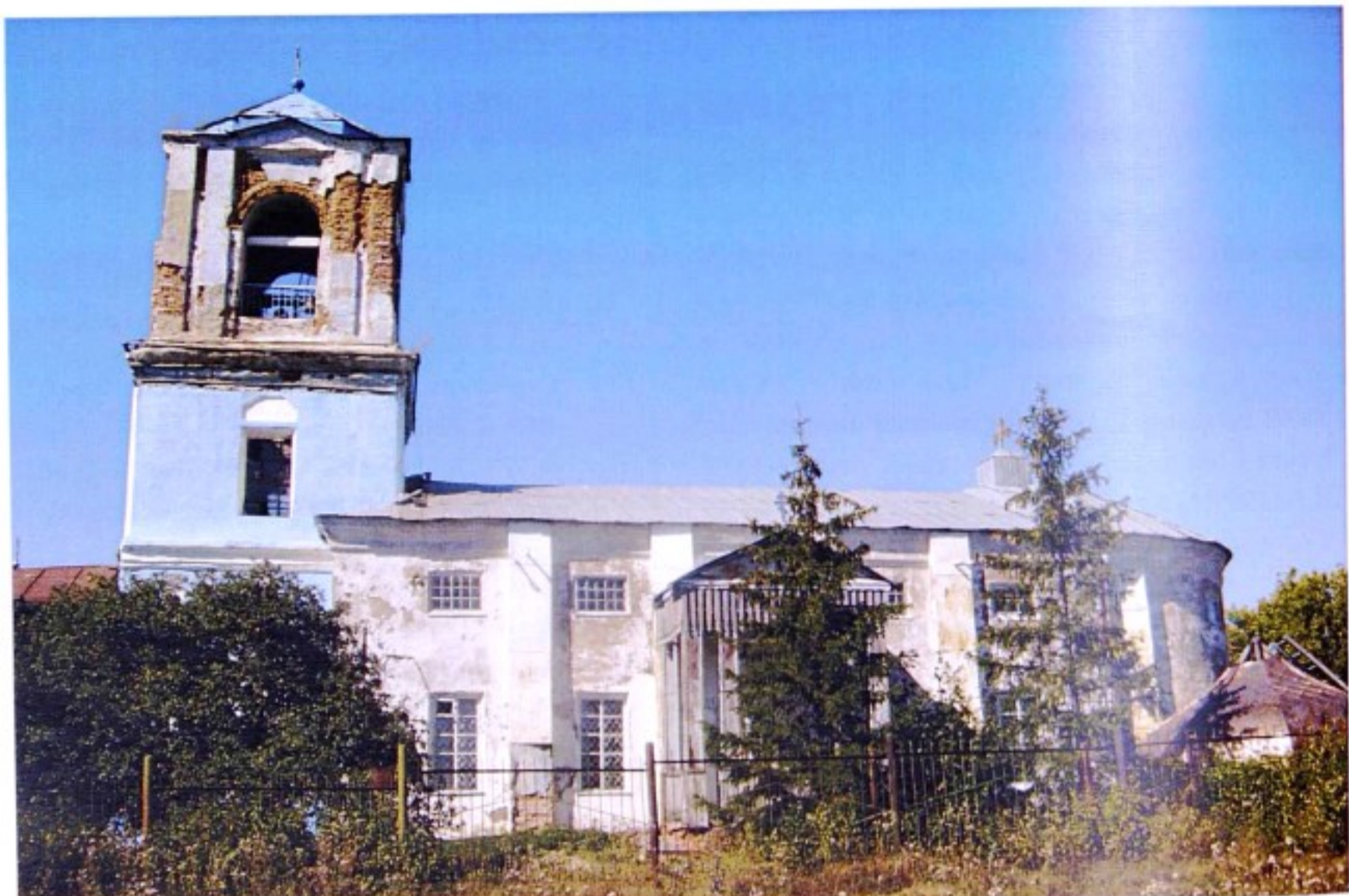
Покровский храм с. Орлянка

Село Орлянка до образования Солнцевского района в 1928 г. входило в состав Тимского уезда.