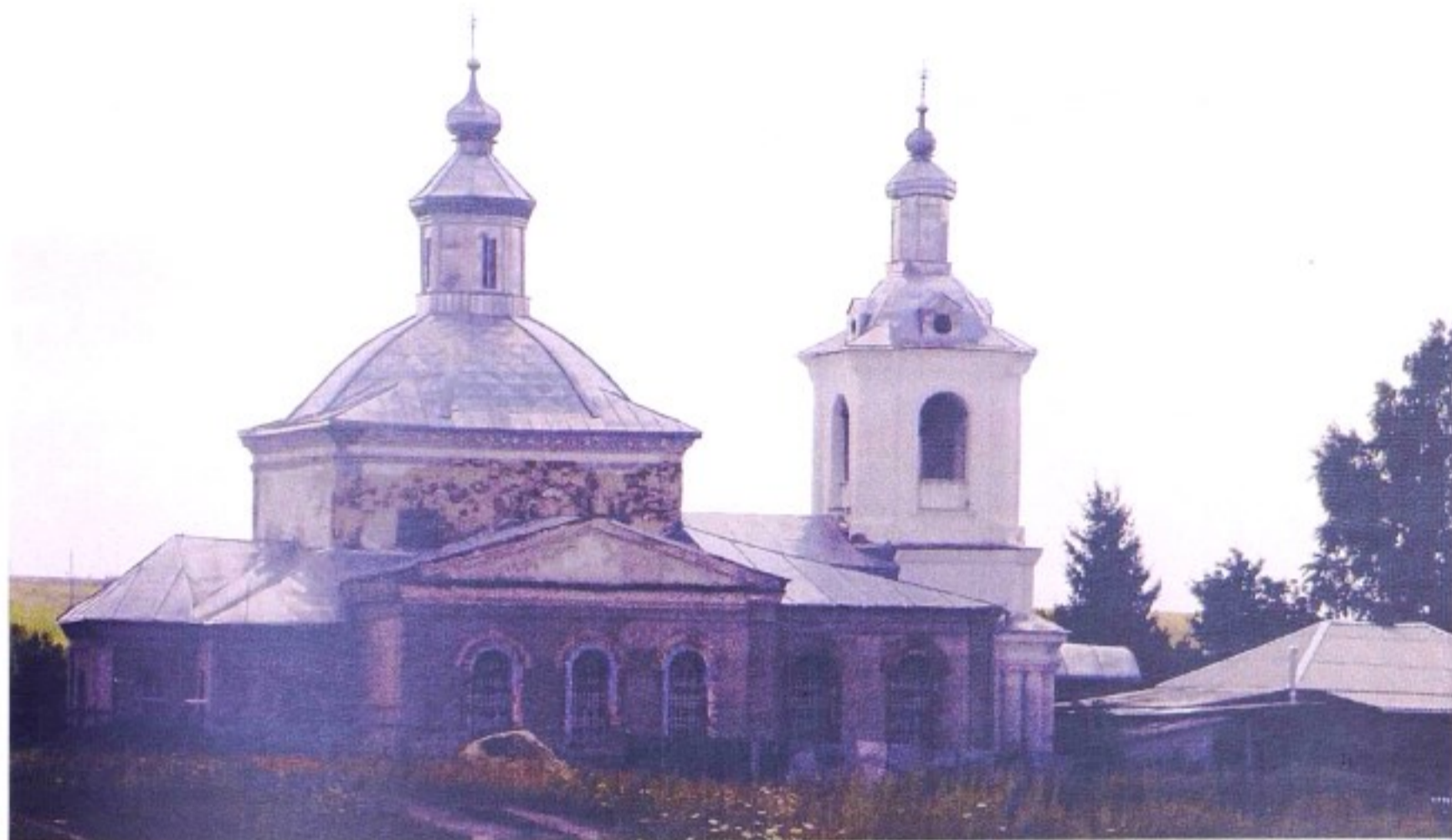
Храм Казанской иконы Божией Матери с. Ключ. 2000 г.

До 1928 г. село Ключ (Ключи) входило в состав Горшеченской волости Нижнедевицкого (до 1923 г. – Землянского) уезда Воронежской губернии, с 1928 г. – в Горшеченский р-н ЦЧО, затем Курской области.