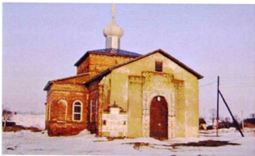
Храм великомученика Георгия Победоносца в с. Малый Змеинец Касиновского сельсовета.