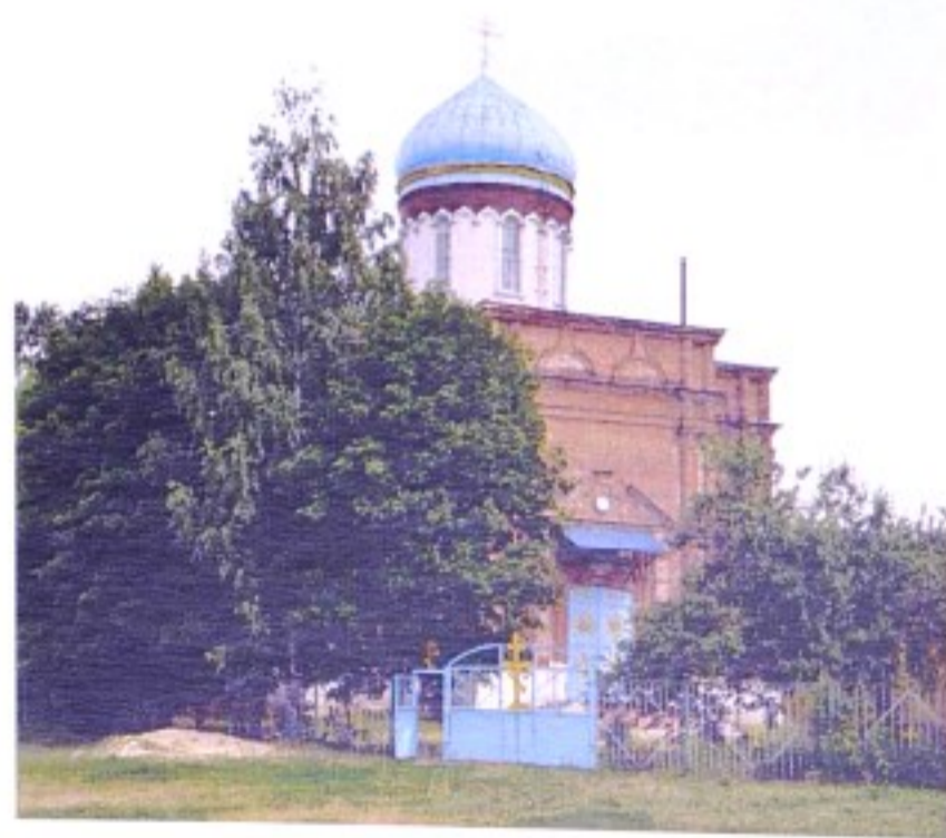
Храм Рождества Пресвятой Богородицы с. Нижнее Гурово. 2013г.

До образования в 1928 г. Советского района с. Нижнее Гурово (Гурово Нижнее) входило в состав Щигровского уезда.