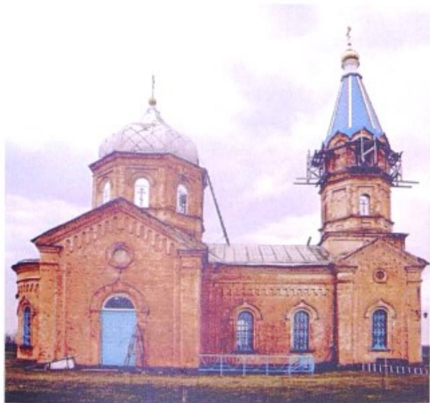
Храм равноап. Марии Магдалины с. Евгеньевка.

До образования в 1928 г. Касторенского р-на с. Озерки, в котором находилась церковь Марии Магдалины, входило в состав Землянского (с 1923 г. – Нижнедевицкого) уезда Воронежской губернии.