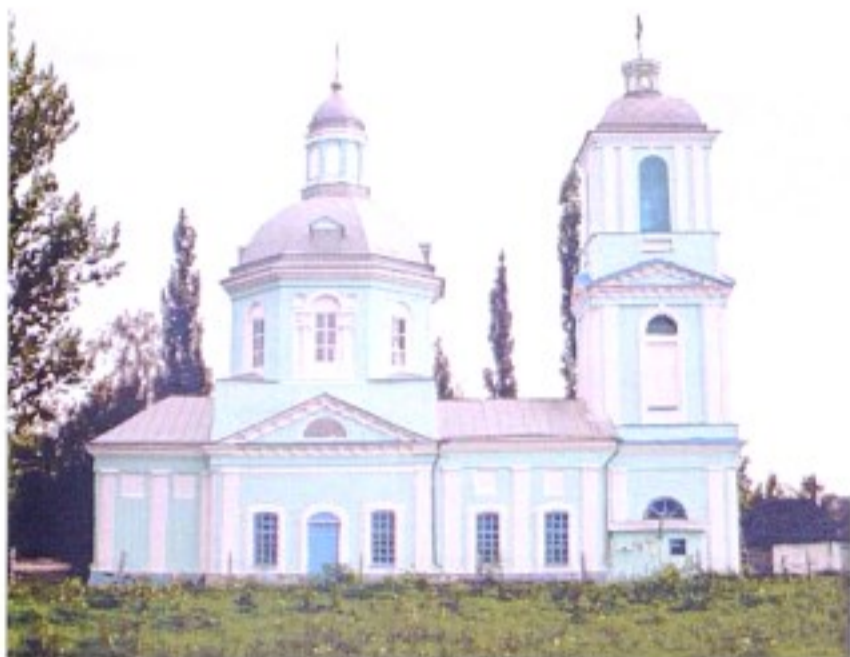
Покровская церковь с. Красная Долина

До 1928 г. село входило в состав Касторенской волости Нижнедевицкого (до 1923 г. – Землянского) уезда Воронежской губернии, с 1928 г. – в Касторенский р-н ЦЧО, затем Курской области.