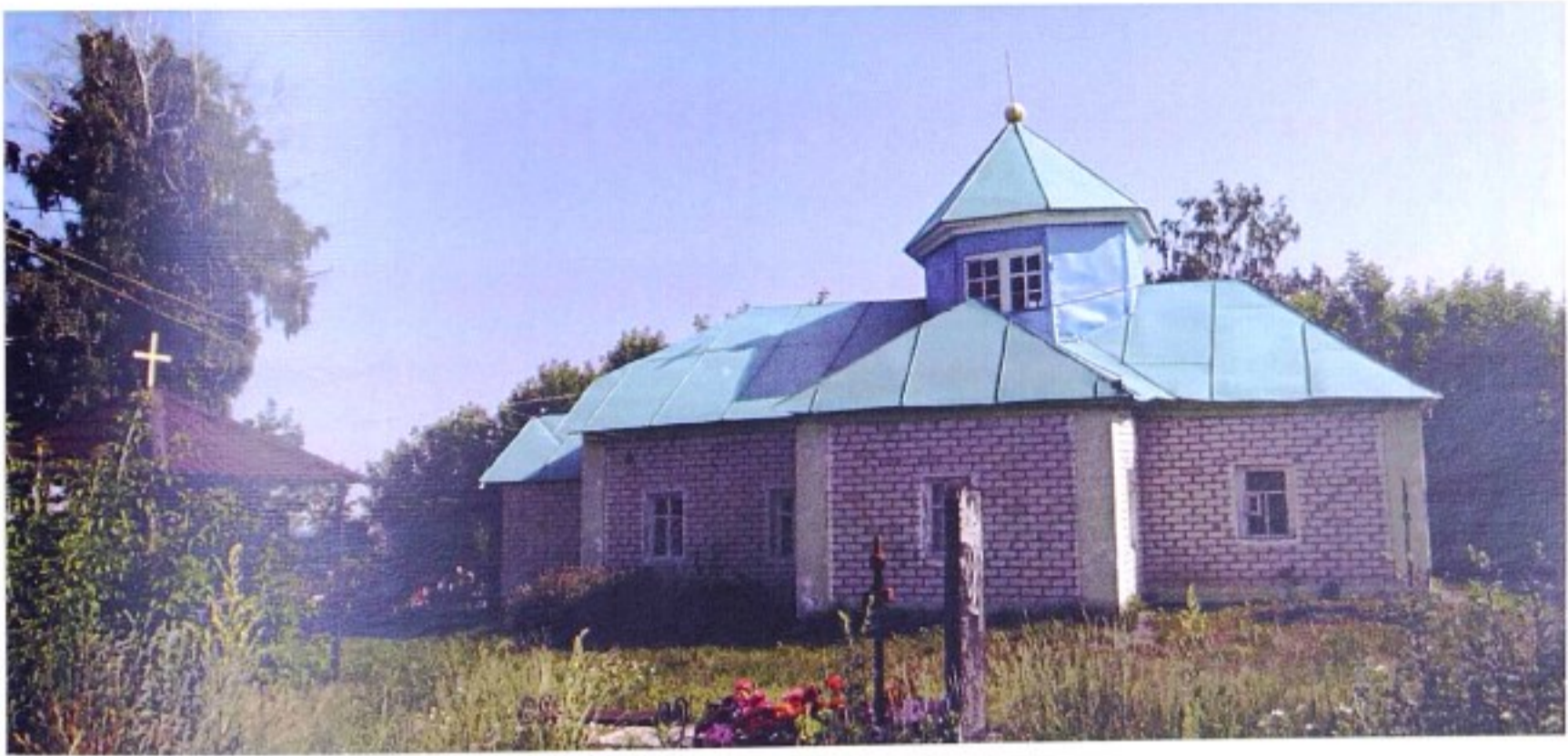
Троицкая церковь с. Бунино

До 1924 года с. Бунино входило в состав Тимского уезда, с 1924 г. – в Курский уезд, с 1928 – в состав Солнцевского района. В документах и справочных изданиях храм именуется Троицким.