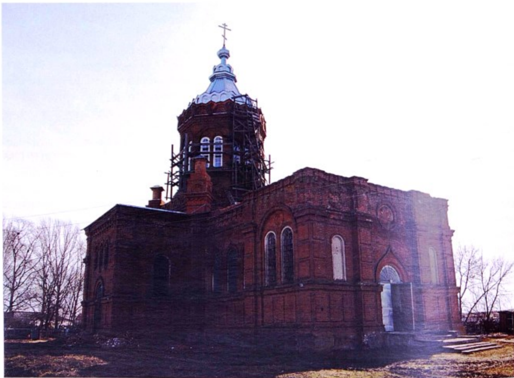
Храм иконы Казанской Божией матери в с. Мелехино

Казанская церковь с. Мелехино построена в 1792 г. на средства прихожан. Здание храма деревянное, холодное. Рядом располагалась деревянная прочная колокольня. Вокруг храма поставлена прочная деревянная ограда. 1 В 1902 г. храм был капитально отремонтирован.