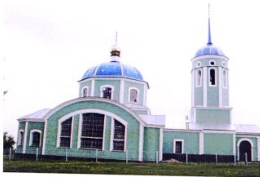
Дмитриевский храм с. Репец.