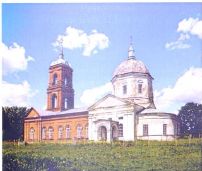
Свято-Троицкий храм с. Орехово