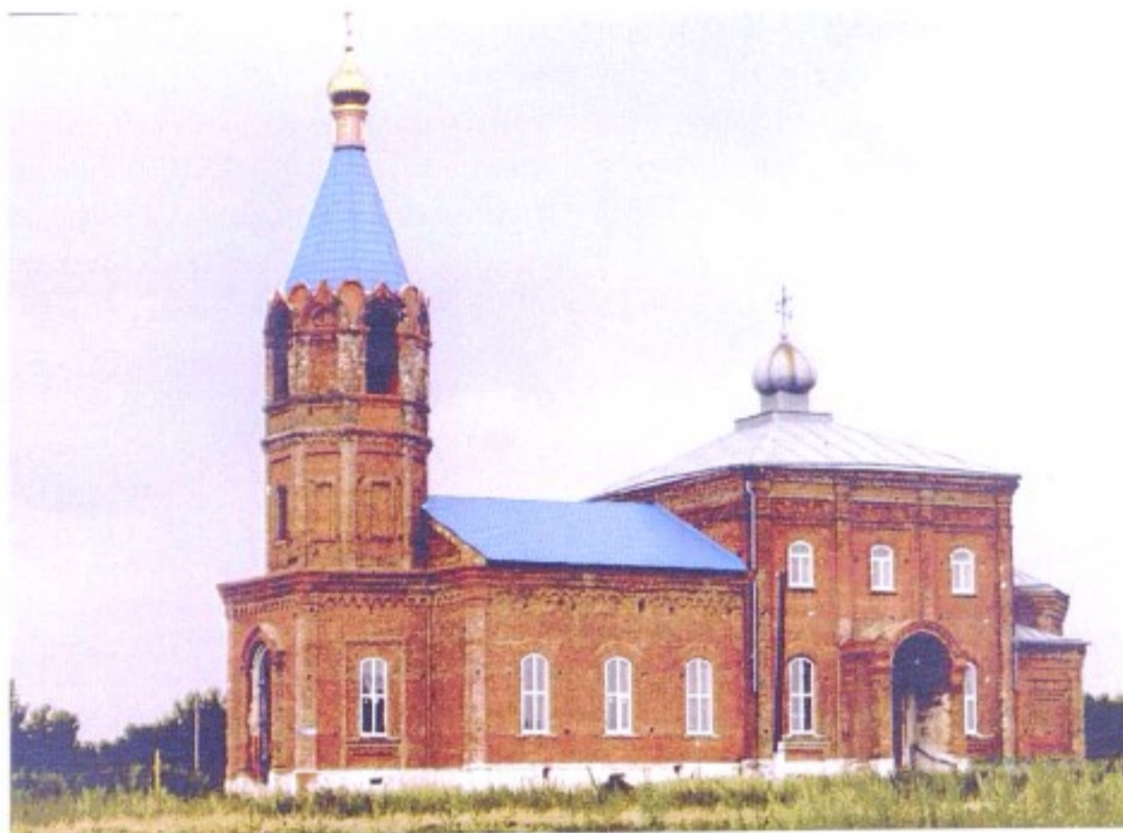
Владимирский храм с. Гущино.

До 1924 г. село Гущино входило в состав Тимского уезда, с 1924 г. – в состав Щигровского уезда, с 1928 г. – в Солнцевский р-н, с 1935 г. – в Мантуровский р-н, с 1963 г. – в Солнцевский р-н, с 1964 г. – в Тимский р-н, с 1977 г. – в состав Мантуровского р-на.