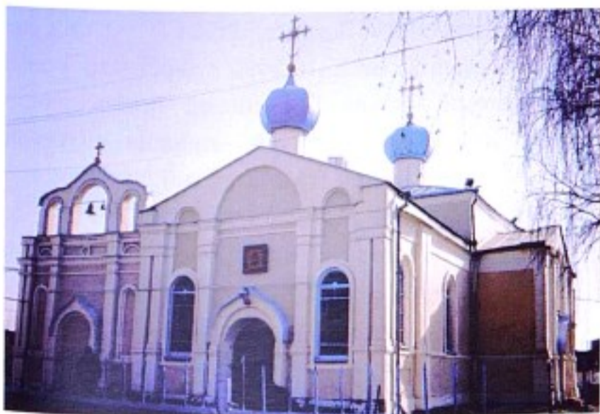
Введенский храм п.Тим

В 1775 г. согласно «Учреждению о губерниях» в составе Курской губернии был образован Тимский уезд с центром в однодворческом селе Тим, получившем с этого времени статус города. 1