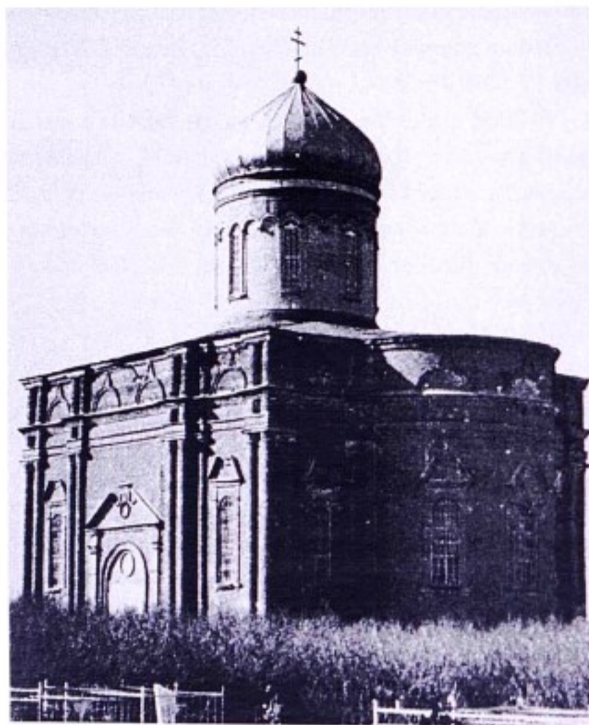
Храм Рождества Пресвятой Богородицы с. Нижнее Гурово. Середина 1950 - х гг.