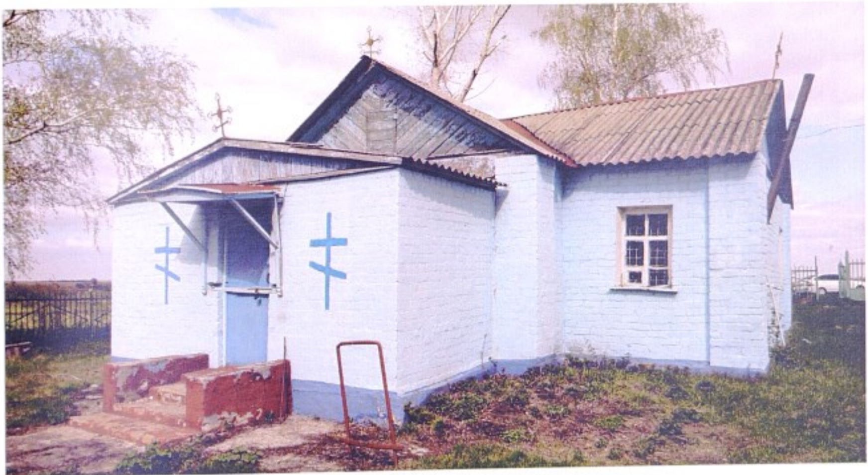
Вознесенская церковь с. Верхняя Ольшанка. 2013 г.

Верхняя Ольшанка входила в состав Обоянского уезда вплоть до 1924 г., постановлением ВЦИК от 12 мая 1924 г. Обоянский уезд был упразднен, Бобрышево вошло в состав Курского уезда, а с 1928 г. – в созданный Обоянский район. В 1935 г. село вошло в Кривцовский район, с его упразднением в 1957 г. относится к территории вновь созданного Пристенского района.