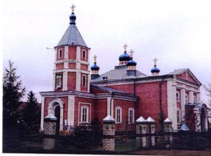
Михайловский храм с. 2-е Засеймье

третье – среднего размера на простой бумаге, переплет бархатный, украшен металлом, четвертое – среднего размера на простой бумаге, крышка металлическая, пятое – малого размера на простой бумаге, крышка бархатная, украшена серебром, шестое – малого размера, переплет металлический. Иконостас и все иконы деревянные, без украшений, за исключением 7 икон, в которых ризы серебряные. Колоколов пять, весом около 135 п. 11