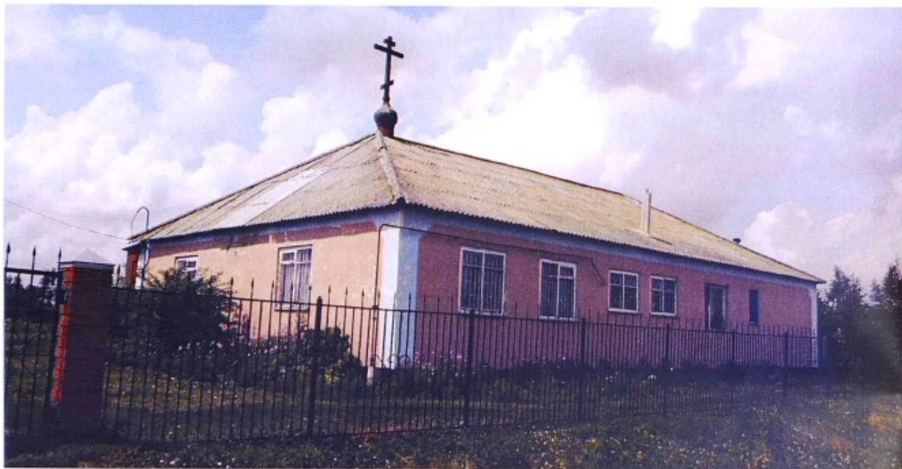
Крестовоздвиженская церковь с. Ясенки.

До 1928 г. с. Ясенки входило в состав Ясеновского с/с Горшеченской волости Нижнедевицкого уезда Воронежской губернии; в 1928 – 1934 гг. – в Горшеченский р-н ЦЧО, с 1935 г. – в состав образованного Ясеновского р-на, с 1956 г. – Горшеченского р-на.