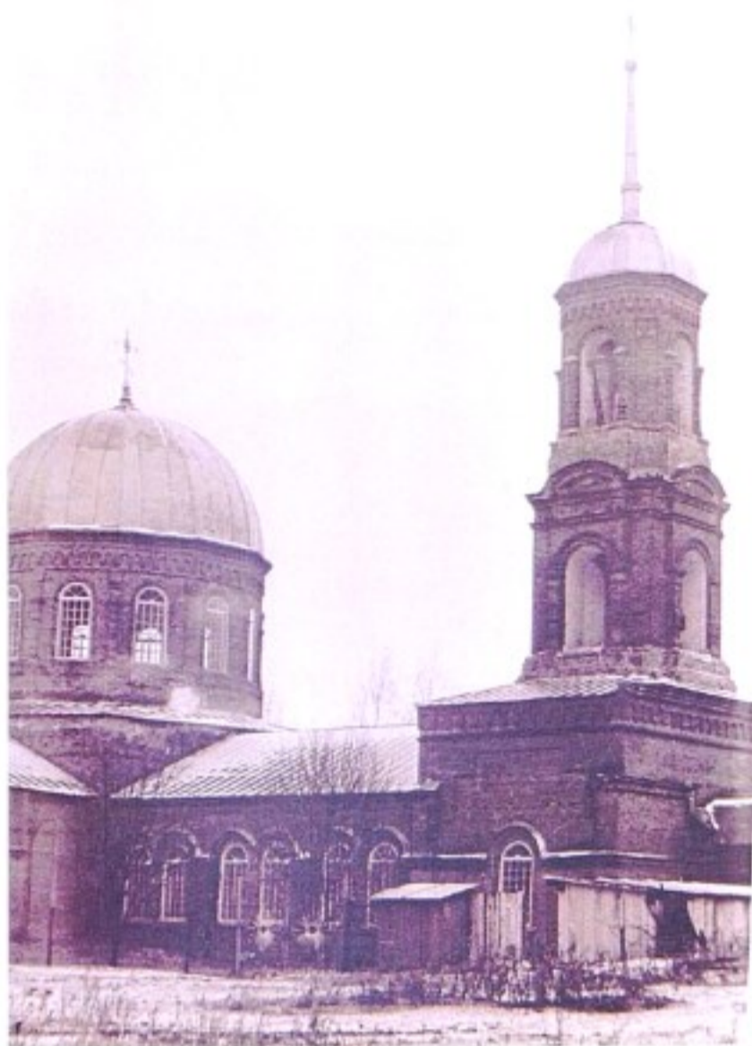
Тихвинская церковь с. Кулевка 1998 г.

делам религий за 1960-е – 1980-е гг. Тихвинская церковь с. Кулевка числится действующей.