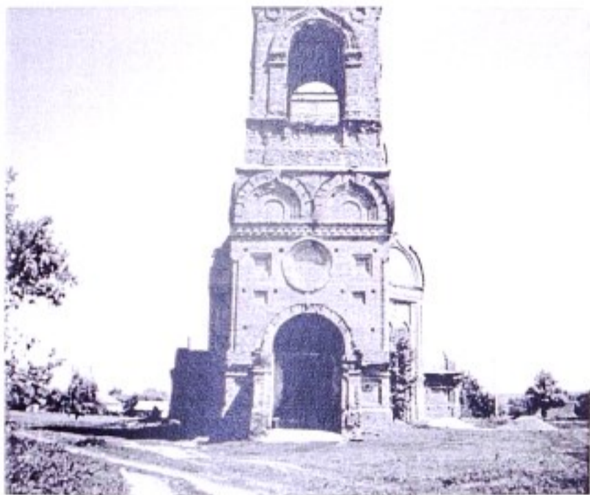
Георгиевская церковь с. Гнилое. 2003 г.

прихода кроме с. Гнилой Колодезь, в котором было 195 дворов (790 м., 815 ж), вошло с. 2-е Гниловское 27 дворов (40 м., 47 ж.); к 1917 г. в Гнилом Колодезе числилось 196 дворов (705 м., 686 ж.). 6