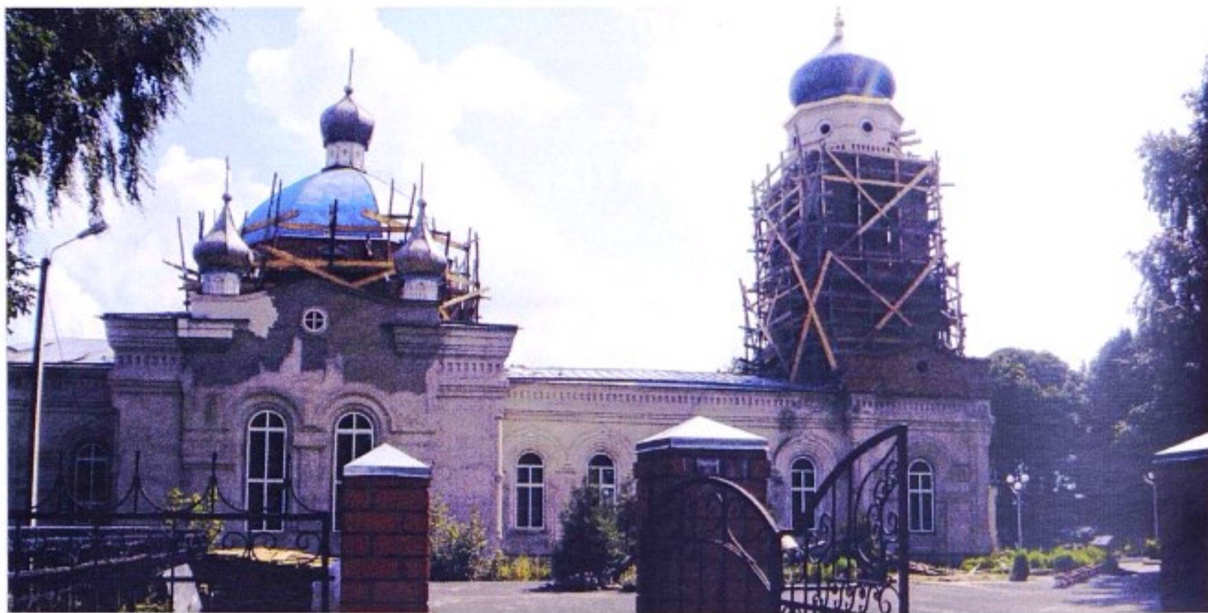
Никольский храм п. Горшечное. 2000 г.

Село Горшечное до 1928 г. входило в состав Горшеченской волости Нижнедевицкого (до 1923 г. – Землянского) уезда Воронежской губернии, с образованием Центрально-Черноземной области был создан Горшеченский р-н, после разделения ЦЧО в 1934 г. он вошел в Курскую область.