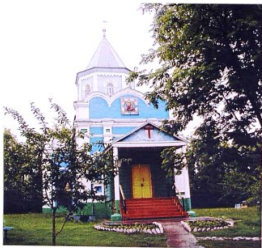
Церковь иконы Божией Матери Неопалимая купина с. Олым

До образования в 1928 г. Касторенского р-на с. Олым (Олымь) входило в состав Нижнедевицкого (до 1923 г. – Землянского) уезда Воронежской губернии, с 1928 г. – в Касторенский р-н ЦЧО, с 1934 г. – в Касторенский р-н Курской области.