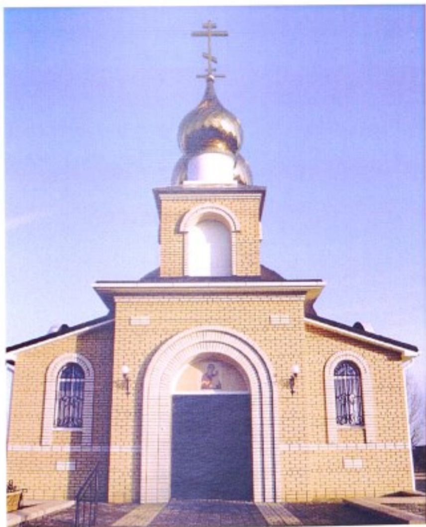
Тихвинский храм с. Ястребовка.

церковных ценностей, находящихся в пользовании групп верующих» от 23.02.1922 г. из храма было изъято 23 предмета весом 10 ф. 43 зол. 8