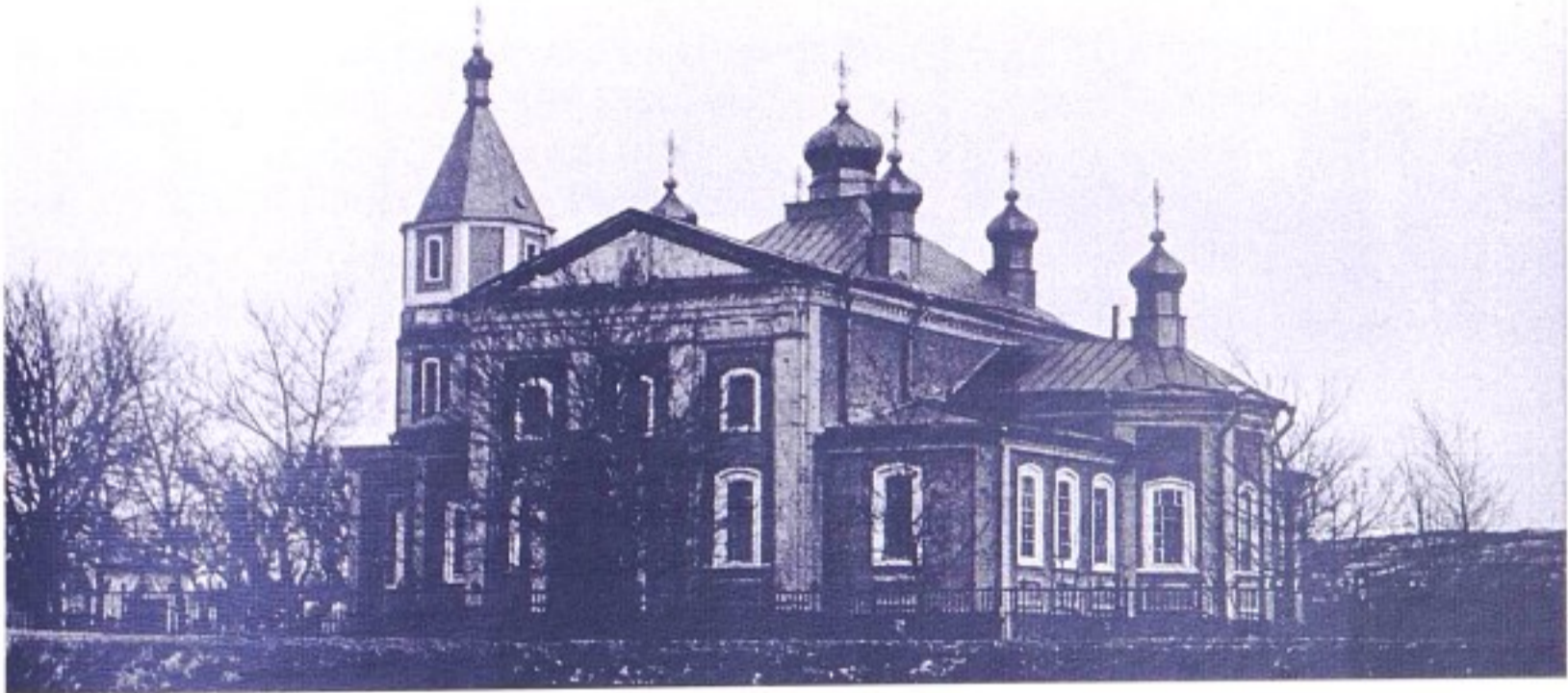
Михайловский храм с. 2-е Засеймье. 1995 г.

До 1924 г. село 2-е Засемье (с. Засемское, Засемское) входило в состав Тимского уезда, с 1924 г. – в Курский уезд, с 1928 г. – в Тимский р-н, с 1935 г. – Мантуровский р-н, с 1963 г. – Солнцевский р-н, с 1964 г. – в Тимский р-н, с 1977 г. – Мантуровский р-н.