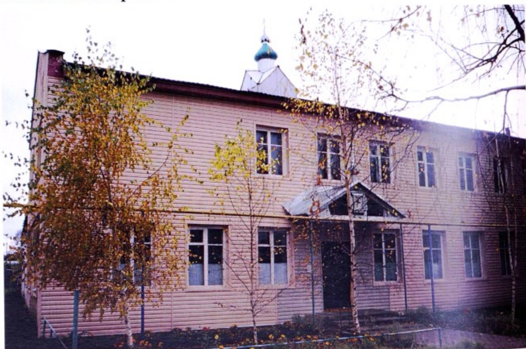
Никольский храм п.Кшенский. 2009 г.

Рабочий поселок Кшенский Советского района образован 17 июля 1958 г. в результате слияния пос. Советский и пос. Кшенского сахзавода. До образования в 1928 г. Советского р-на пос. при станции Кшень МКВ ж.д. (пос. Советский, пос. Кшенский) входил в состав Щигровского р-на.