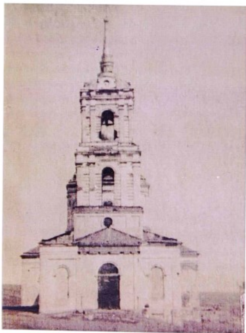
Архангельская церковь с. Погожево. 1959 г.