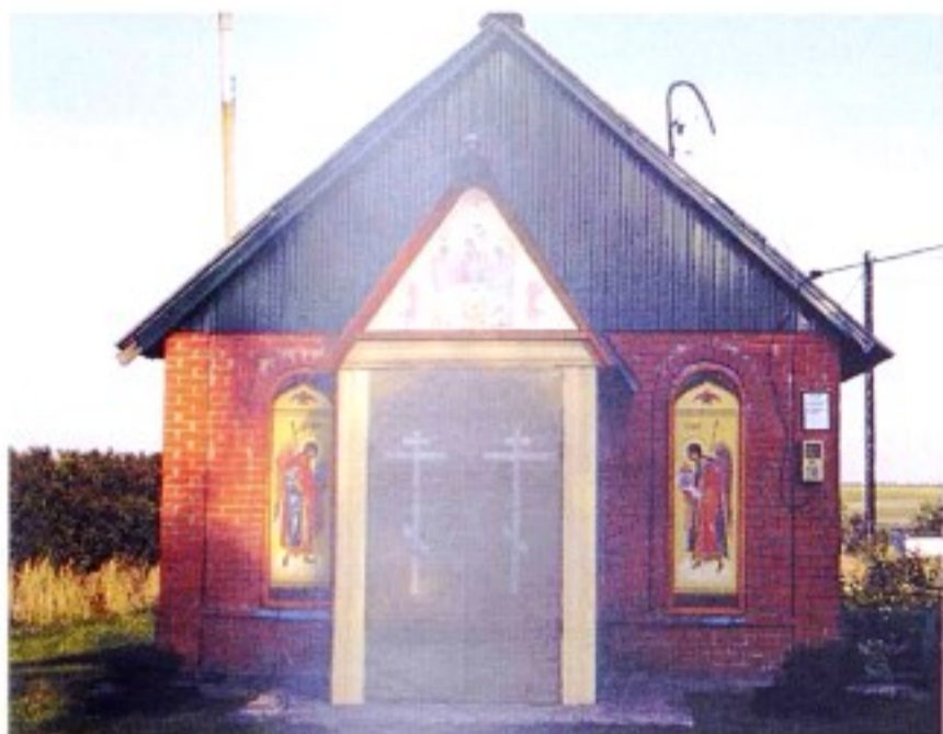
Свято-Троицкий храм с. Рогозцы

До 1924 г. село входило в состав Тимского уезда, с 1924 г. – в Щигровский уезд, с 1928 г. – в Тимский р-н, в 1963 г. – в состав Щигровского, с 1964 г – в состав Тимского района.