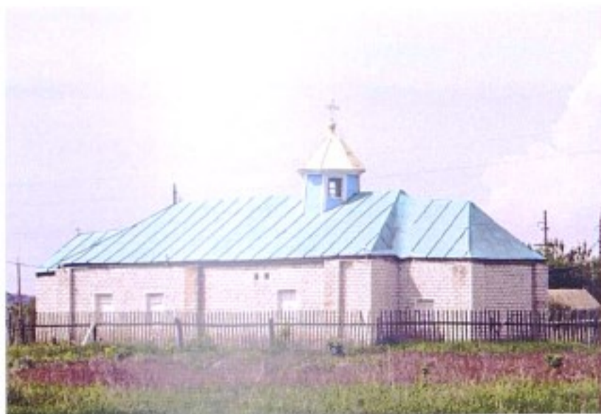
Афанасьевский храм с. Афанасьевка

Село Афанасьевское (Афанасьевское, что на Хону, Афанасьевка) до образования Солнцевского района в 1928 г. входило в состав Тимского уезда.