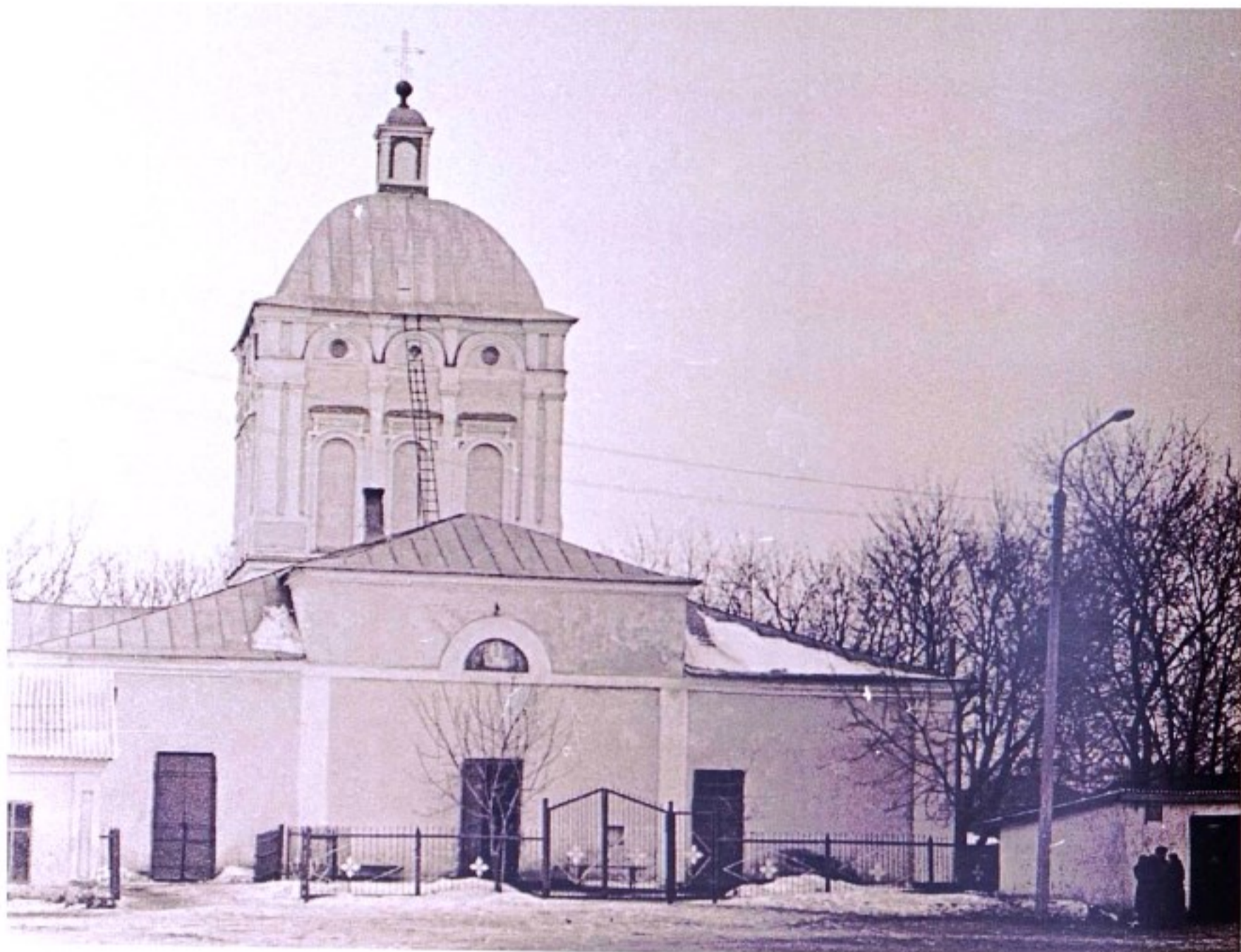
Успенская церковь с. Касторное. 1978 г.

До образования в 1928 г. Касторенского р-на село (сейчас поселок городского типа, райцентр) Касторное входило в состав Касторенской волости Нижнедевицкого ( до 1923 г. – Землянского) уезда Воронежской губернии.