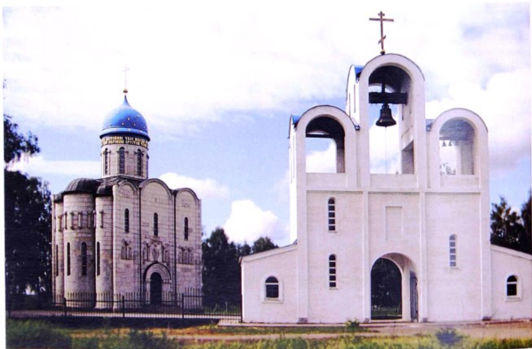
Покровский храм с. Мармыжи. 2008 г.

До образования в 1928 г. Советского района с. Мармыжи входило в состав Щигровского уезда.