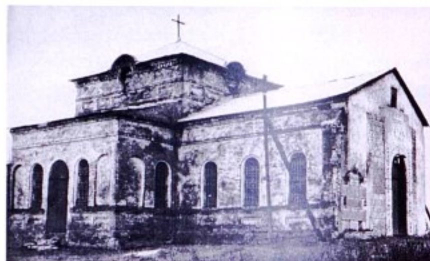
Храм Георгия Победоносца с. Малый Змеинец.