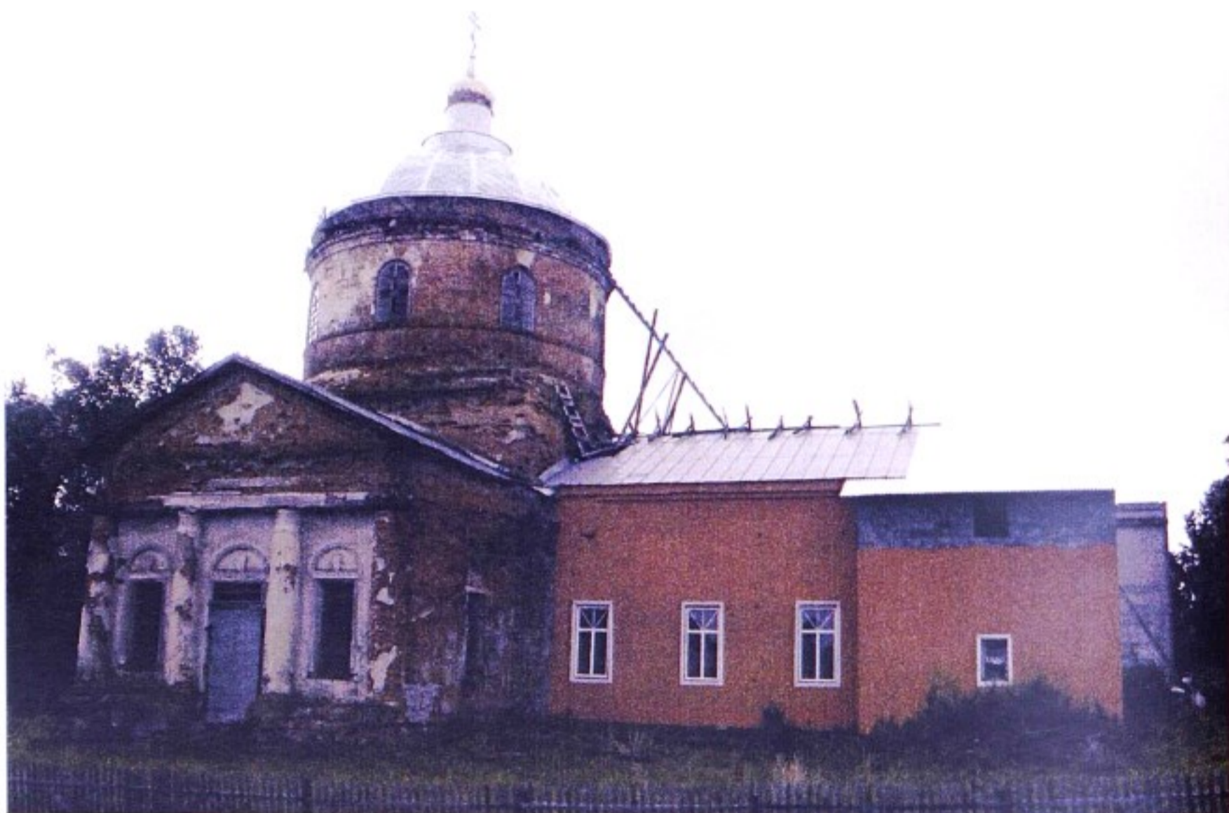
Дмитриевский храм с. Средние Апочки

До образования в 1928 г. Ястребовского района с. Средние Апочки (Средние Опочки, Апочки Средние) входило в состав Старооскольского уезда Курской губернии, с 1928 по 1930 г. – в состав Ястребовского р-на, с 1930 по 1935 гг. – в состав Старооскольского р-на, с 1935 г. – в состав Ястребовского р-на, с 1964 г. – в состав Горшеченского р-на.