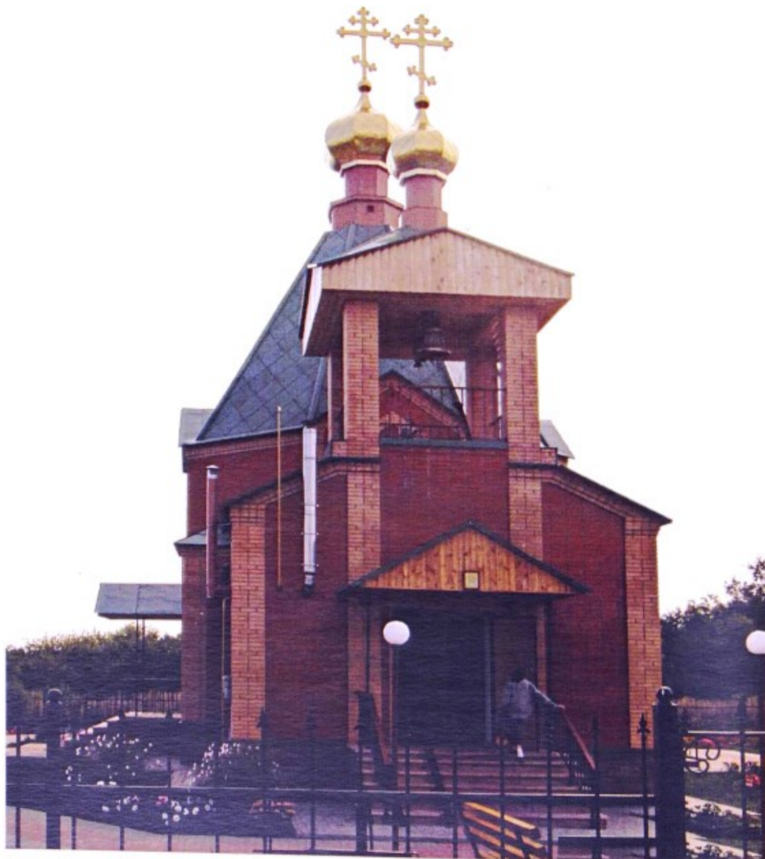
Христорожественский храм с. Верхние Апочки

До 1802 г. с. Верхние Апочки (Апочки Верхние, Верхние Опочки) входило в состав Старооскольского уезда Курской губернии, с 1802 г. по 1928 г. – в состав Тимского уезда, с 1928 г. – в состав Советского района.