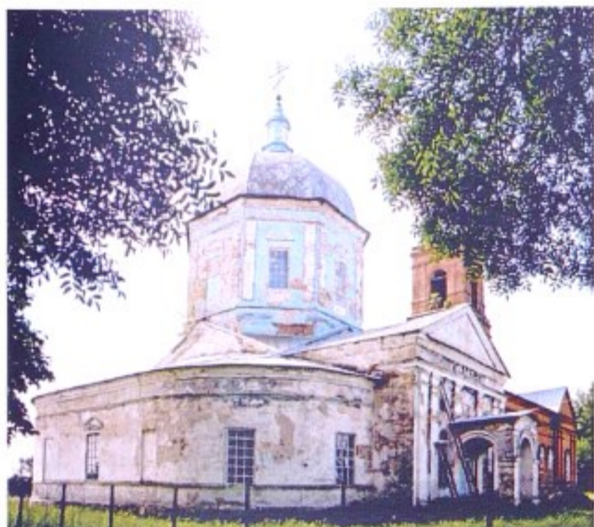
Свято-Троицкий храм с. Орехово

До образования в 1928 г. Касторенского р-на с. Орехово входило в состав Касторенской волости Нижнедевицкого (до 1923 г. – Землянского) уезда Воронежской губернии, с 1928 г. – в Касторенский р-н ЦЧО, с 1934 г. – в Касторенский р-н Курской области.