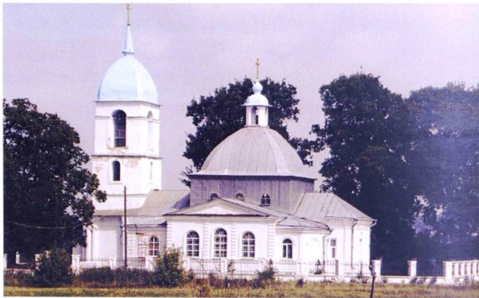
Покровский храм с. Кунье. 2000 г.

До образования в 1928 г. Ястребовского р-на с. Кунье входило в состав Старооскольского уезда Курской губернии, с 1930 г. – в состав Старооскольского р-на, с 1935 г. – в состав Ястребовского р-на, с 1963 г. – в состав Горшеченского района.